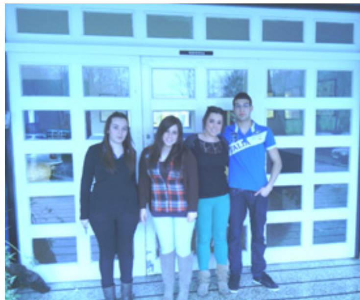
Zulaibargo ikasleak ikastetxeko sarreran.

Ikasleak ikasteko egiten dituen ahalegin guztiak ikusita, ikasleak laguntzeko ikasketak plan personalizatuak prestatzen doguz. Lan ordutegia, lan esperientzia