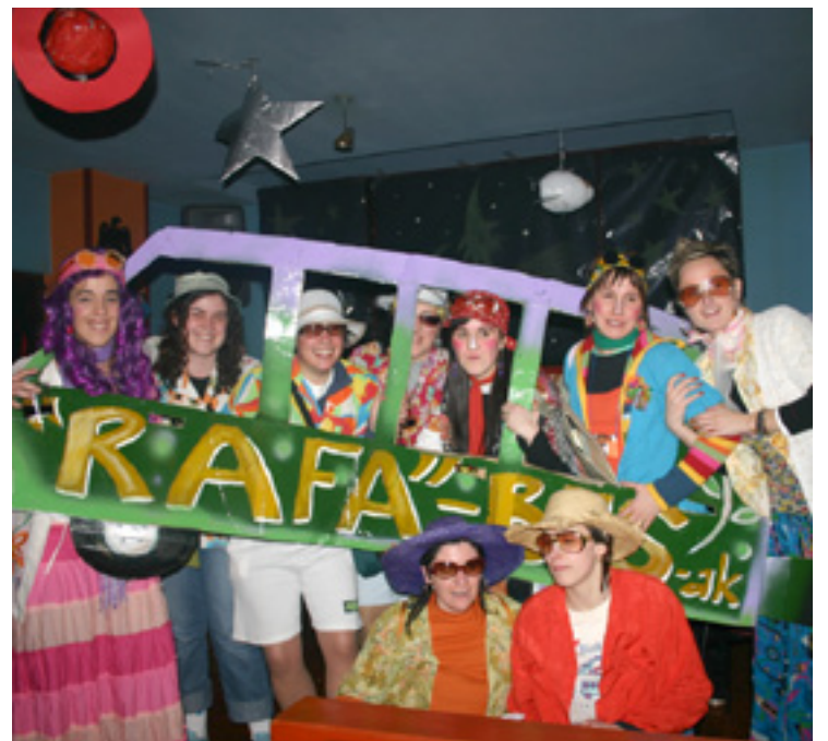
Orain dala urte batzuk Igorren hartutako argazkia.

jaiak egingo dabe ondoren herriko plaza zein eskola inguruetan. Igorren, Lemoan eta Diman, barriz, zapatua aukeratu dabe mozorro lehiaketak egiteko. Erromeriak be egingo dira eta Igorren jaiak egun eta herri osoa hartuko dau. Jai honeetako atzenengo egunean, martitzenean, izango dira Bedian eta Zeanurin mozorro jaiak. 5. eta 6. orrialdeak