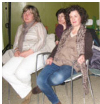
Batzarrera hurreratutako batzuk.

Aisialdia eta parte-hartzea be sano berezita dagoz andra eta gizonen artean.