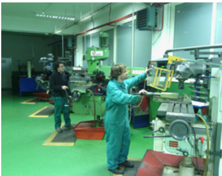
Zulaibargo ikasleak makinakaz beharrean.