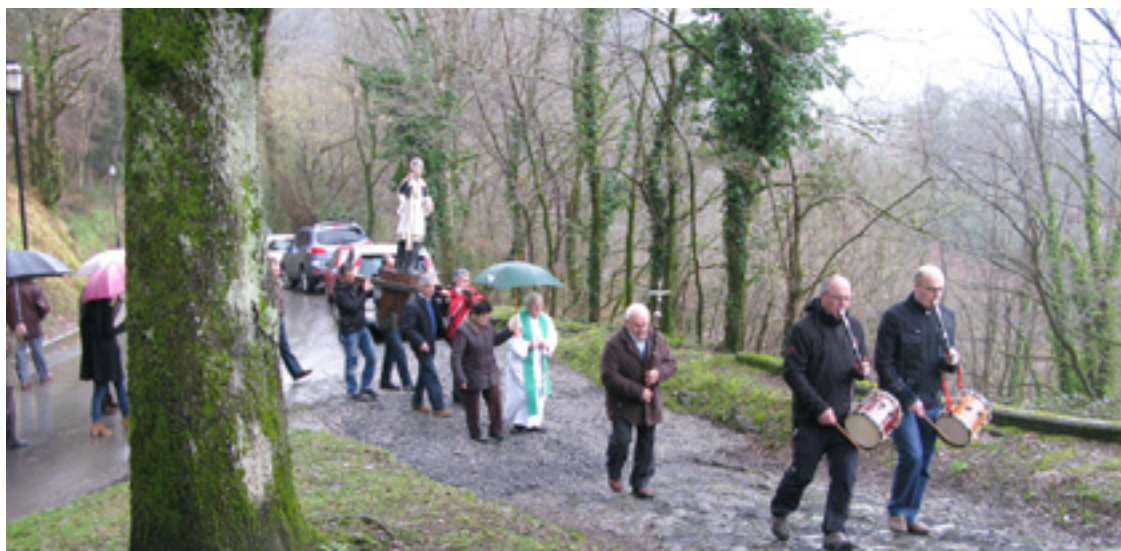
Prozesinoan Balendin santuagaz.

Fritz Lang (Viena 1890-Kalifornia 1976) zinema zuzendari, gidoigilea eta noizbehinkako ekoizlea izan zan. Alemaniako zinema-eskola espresionistan parte hartu eban eta Hollywoode-ra joan zan XX. mendeko 30eko hamarkadan. Metropolis (1927), Furia (1936) edo Solo se vive una vez (1937) film famaduen zuzendari da Lang.