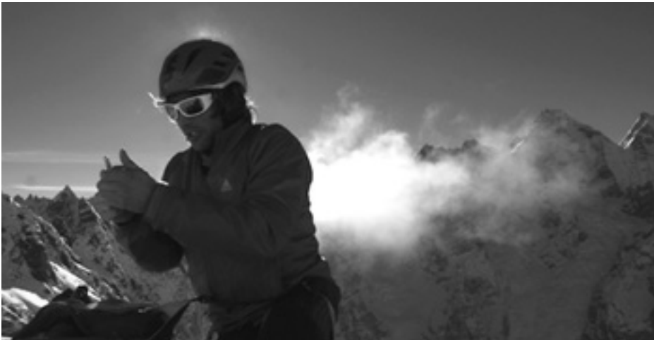
Alex Txikon walkitik berbetan.