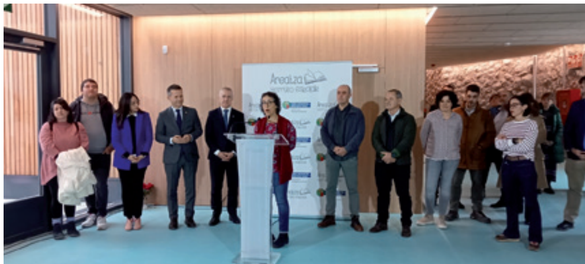
Areatzako eskolako inaugurazino ekitaldia.

Gimnasioaz gainera, eraikin bien artean, sarrerako gune barri bat egin da. Atari honek eraikin biak eta etapa biak lotu, batu eta artikulatzen ditu, eskola moltso bakarra osotuz. Kanpokaldean be espazio batasuna lortzeako, eraikin bien lursailak bereizten ebazan hormea bota da. Orubearen hegoaldean, eutsi egin jakie egoitzak eukazan berdegune eta lorategiei, eskoleak erabili dagiazan.