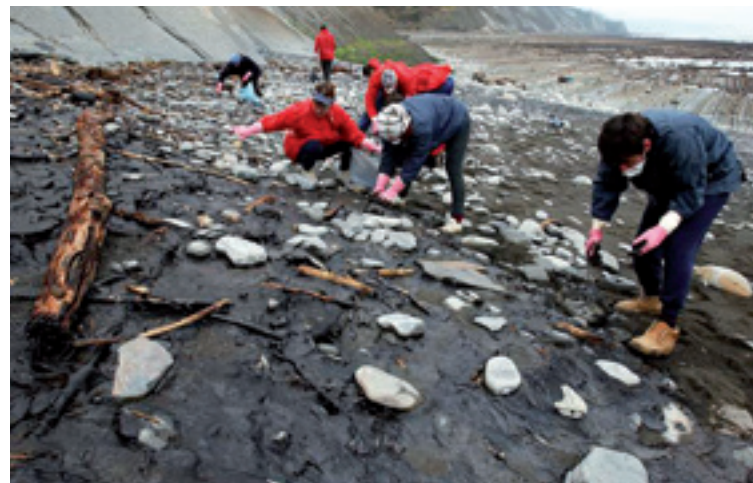
Euskal Herriko kosta garbitzen.