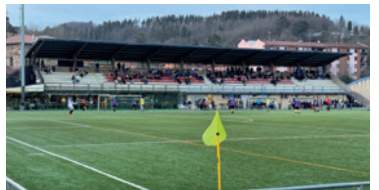
Gizonezkoen Arratia A eta Dinamo San Juanen arteko partidua.

Andrazkoen Arratia Ak Salamanca FFren kontra, eta gizonezkoen Ak Dinamo San Juanen kontra bardindu egin ebezan euren partiduak etxean. Andrazkoen Arratia B taldeak galdu egin eban Basauriko Kimuak B liderraren kontra etxetik kanpo. Gizonezkoen Arratia Bk Ermuaren kontra etxetik kanpo eta Lemoako Harrobik Begoña A taldearen kontra Arlonagusian galdu egin ebezan euren partiduak.