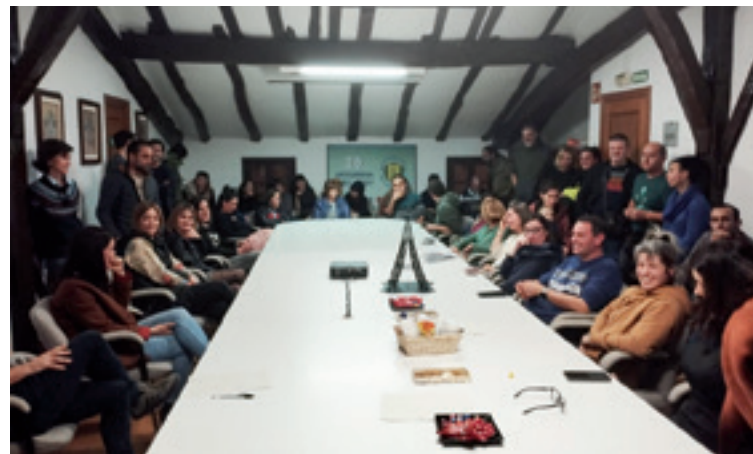
Arratiako Udalen Mankomunitatean egindako batzarra.

Informazio gehiago jaso gura dabenek, prebentzioa@arratia.eus helbidera idatzi edo 688 643 305 zenbakira deitu leikie.