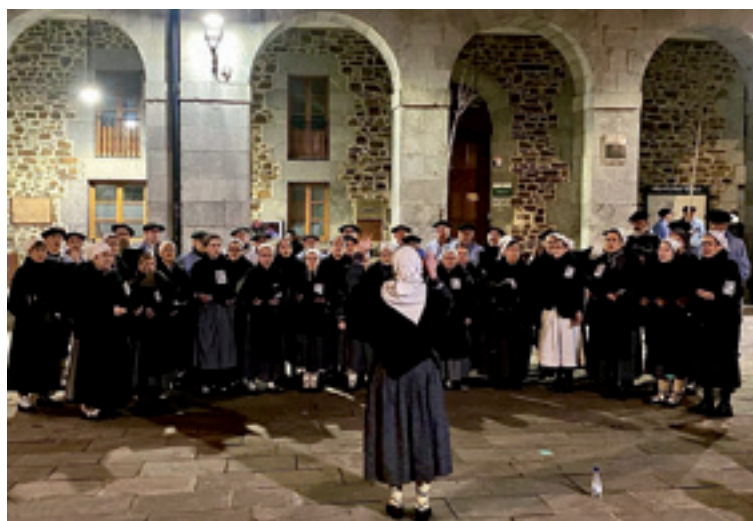
Arratiako Korua igaz Areatzan.

Igorren, guraso alkarteak eta Arantzarte jantza taldeak deituta, 11:30ean batuko da edade guztietako jentea Kultur Etxean, herritik zehar eske errondeari