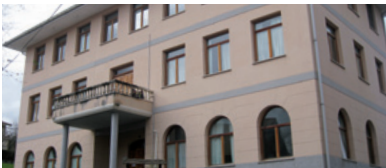
Arteako Kultur Etxea.