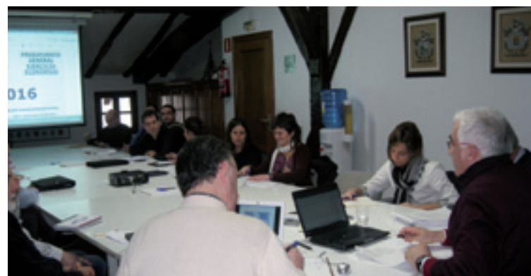
Aurrekontuetako Osoko Bilkura.

Beste zerbitzuen gastuen banaketea aztertzeke konpromisoa be hartu eban Etxebarriak.