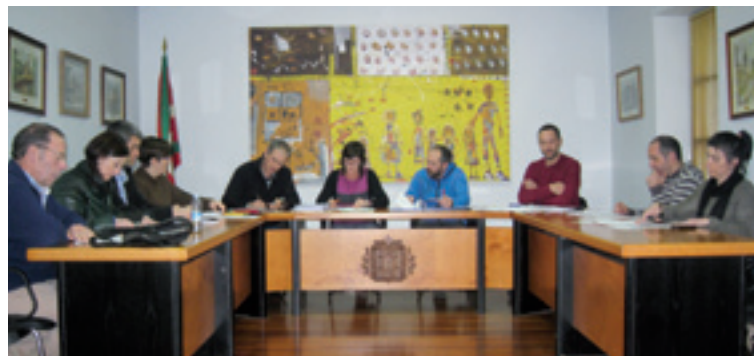
Aurrekontuetako Osoko Bilkura.

2017ko aurrekontuak prestatzeko parte hartze prozesua zabalduko asmoa adierazo eban alkateak, "herriar guztien artean aurrekontu hobeak aterako diralako".