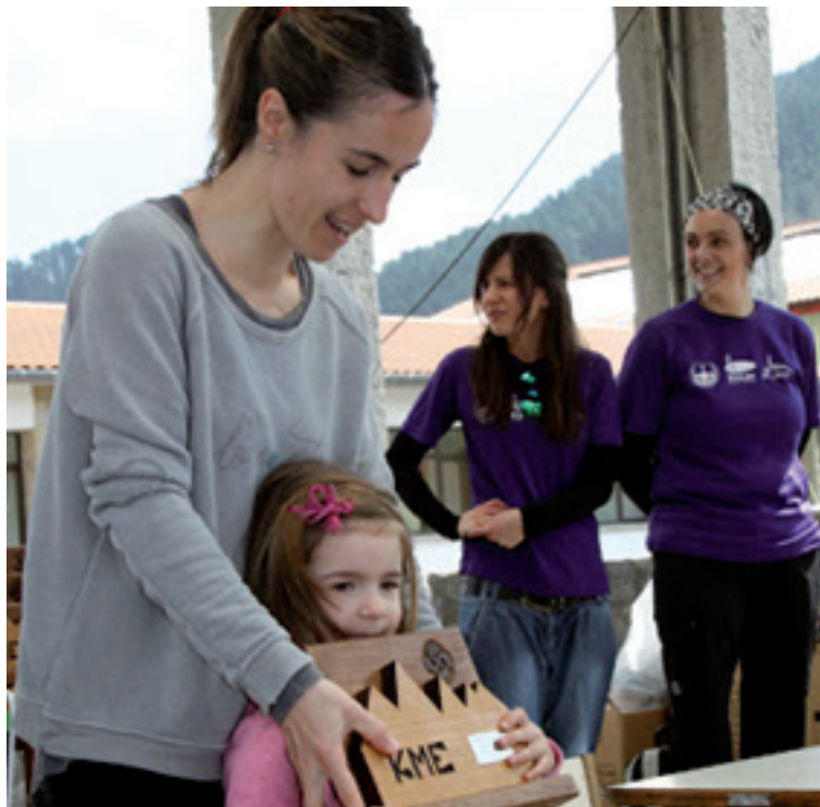
Igazko sari banaketean.