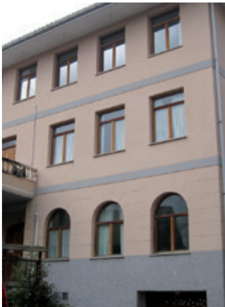
Arteako Kultur Etxea.