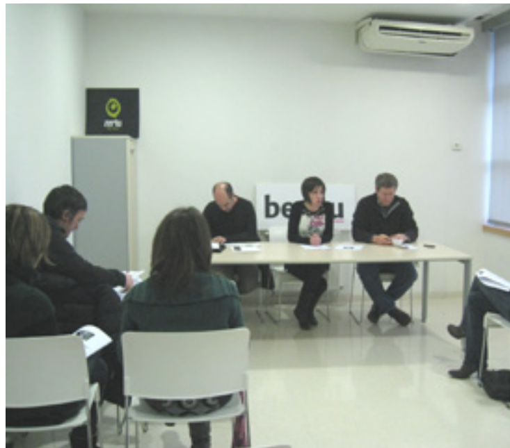
Zerturen Batzar Orokorra.