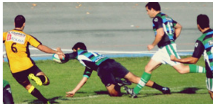
Arratiko Zekorrak partidu baten.

azken emoitzea. Sailkapenean bigarren dagoz Zekorrak. Holan jarraitu ezkerro, mailaz igoteko aukerak daukiez. Hurrengo partidua San Txismen izango da, domekan, hilak 19, goizeko 11:30ean Irun RT taldearen kontra.