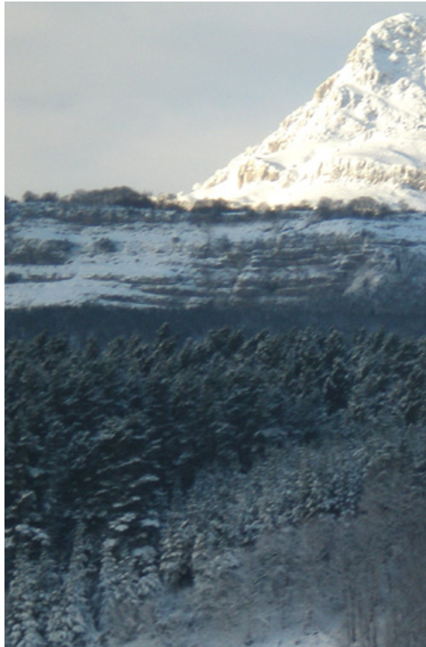
Lekandakoa hatxak zurituta.

Balio handia dauka basoak gurean: biologikoa, ekonomikoa, sinbolikoa... Eta maila guzti horreetan basoagazko gure erlazioetako modua aldatuz doa. Aisialdiari jagokonean, mendi taldeen boom -a daukagu edo Gorbeialde Central Parkek antolatuten dituan jarduerak, mendiaz gozatzeko beste modu batzuk suposatzen dabenak.