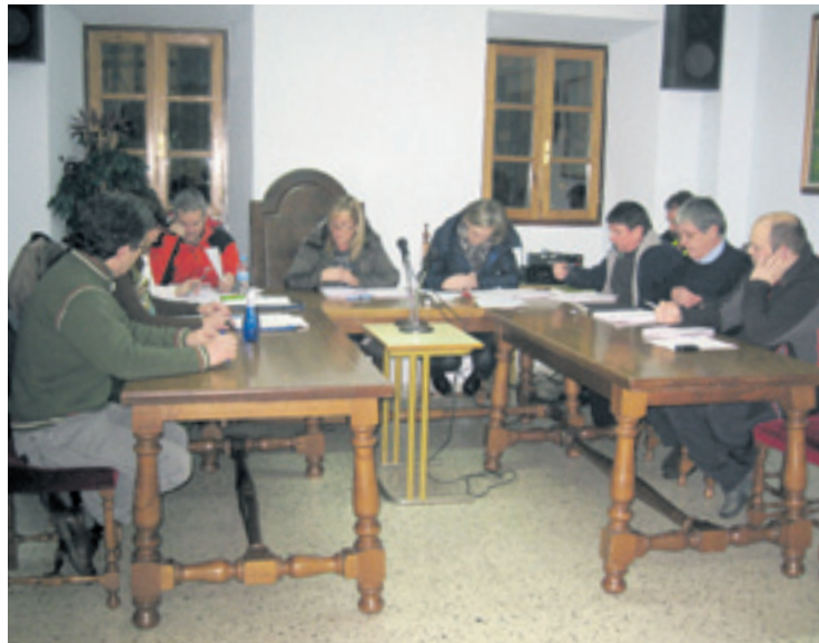
Aurrekontuak onartu ziraneko plenoaren irudia.

Bilduk aurkeztutako zuzenketa partzial gehienak onartu ziran, baina. Tartean, interesetan ordaindu beharreko 4.000 euro agertzea, diru hau ez zan egon jasota eta.