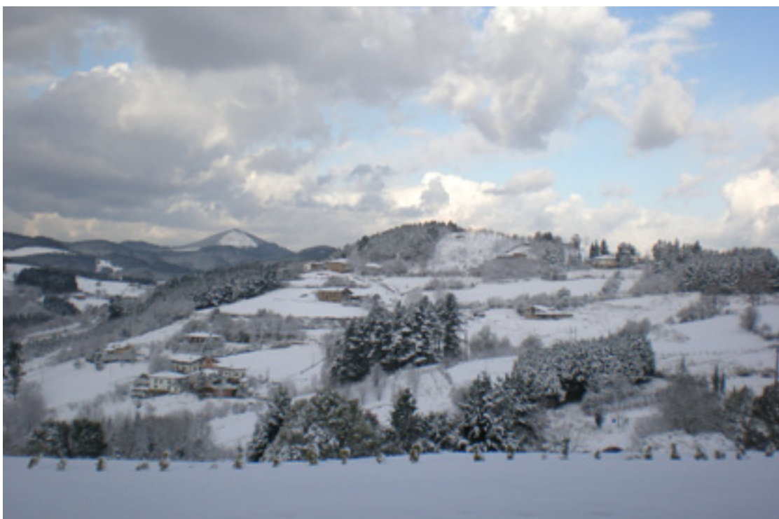
Pinua gaixorik dago.

Basoari errentagarritasuna pinuaren bidez ez (edo ez bakarrik)