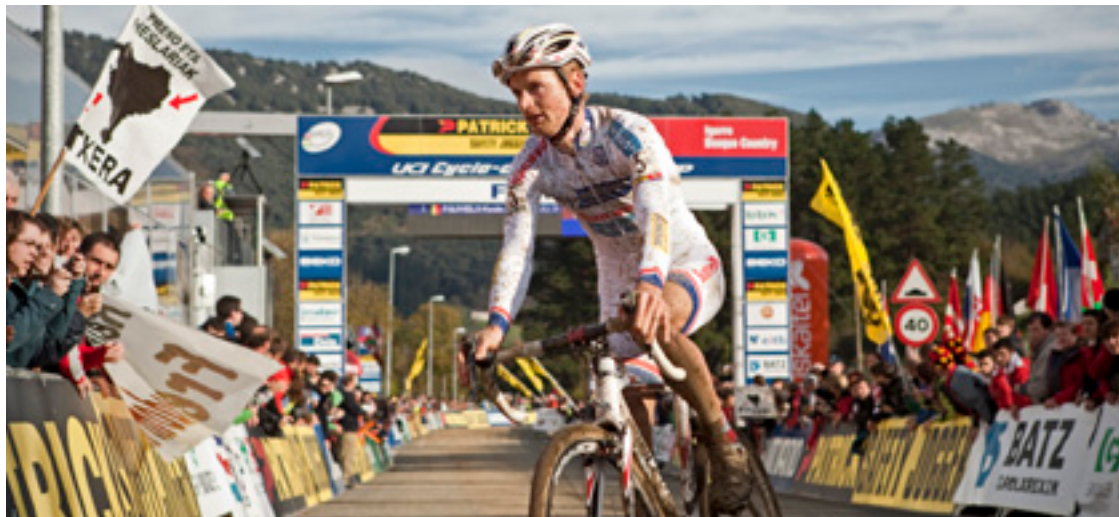
Igazko lasterketako irudi bat.

Honen aurrean zer egin azterzen dabiz AZEkoak, baina Igorren daukiezan diru baliabideak ezinezkoa jotzen dabe kategoria guztietako lasterketak antolatutea.