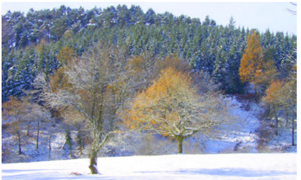
Prozesionaria da basoak daukien gaixotasunik larriena.

Bestetik, basoari errentagarritasuna aterateko beste modu batzuk bultzatzea badago. Modu horreek biomasa eta zuraren beste erabilera batzuk izan daitezke. 8. eta 9. orrialdeak