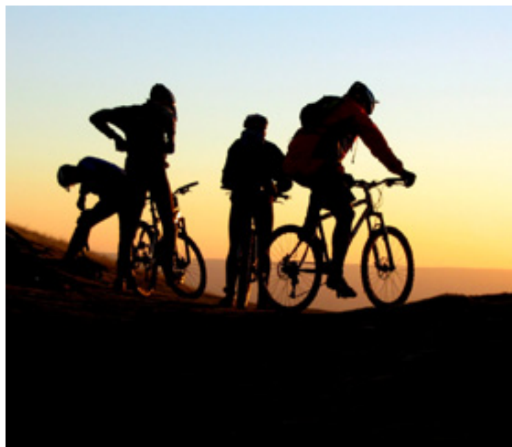
Mendiko bizikletakaz be egingo dabiz urteerak.