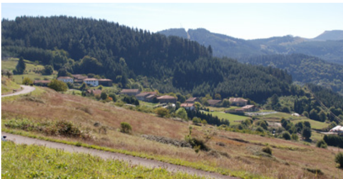
Pinu egurraren prezioa sano bajua da.

Biodibersidadea eta paisajea oinarritzakoak dira pinua ez beste errentagarritasun bideak bultzatzeko