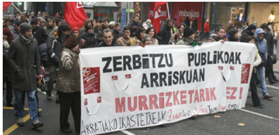
Arratiako ikastetxeetakoak Bilboko manifestazinoan.

21:30ean, Ermitabarriko Taberna Zaharrean mozorro lehiaketea.