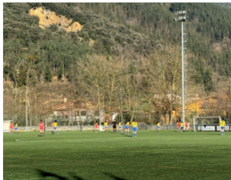
Andrazkoen Arratia B eta Bizkerre C taldeen arteko partidua.

Gizonezkoen Arratia Ak etxean galdu eban, gizonezkoen Arratia Bk eta andrazkoen Arratia Bk etxetik kanpo galdu eben eta Lemoako Harrobik bardindu egin eban etxean.