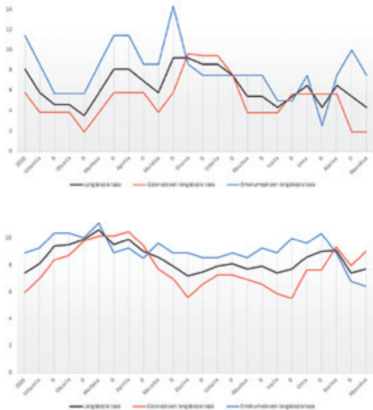
Goian Ubideko datuak eta behean Zeberikoak.

rian, langabezia tasa %9,4tik (gizonen %8,39 eta andrek 10,37), %7,70ra pasau zan (gizonen %9 eta andrek %6,41) denpora tarte horretan. Holan, Arratia Ubide eta Zeberiko batz besteko langabezia tasa, %9koa zan 2020ko martian eta %7,89koa 2021eko abenduan. Gizon eta andren taseari erreparau ezkeru, gizonen langabezia batez besteko tasa %7,83tik %7,38ra pasau zan eta andrazkoena %10,29tik %8,49ra jeitsi zan.