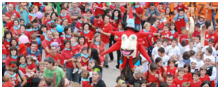
Zuztertxu igorreztarrez inguratuta.

Daborduko aurtengo Euskarearen Eguna ate joka daukagu eta Igorren hasita dagoz egun horri begirakoa antolatuta. Aurten kultur eta kirol alkarrean urtea dala esan geinke, izan bezala, INBIU eguneko Lip Dub arrakastatsuan Igorreko alkarre guztiak bat eginda agertu ziran