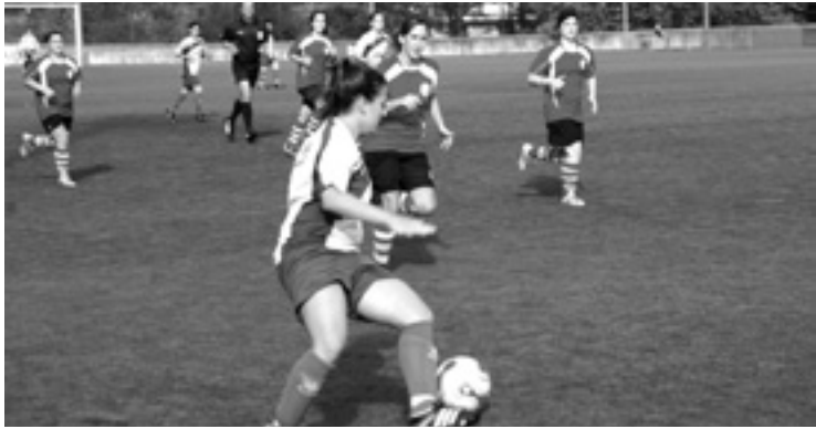
Arratia futbol taldeko neskek lehenengo dira sailkapenean.

Arratiako neskek eta mutilak be bardin segiduten dabe, baina euren egoereak ez dauka zerikusirik Lemoako enagaz. Bai batzuk eta bai besteak irabazi egin dabe azken bi jardunaldietan eta lehenengo dira sailkapenean. Neskek 1-0 irabazi eutsien Iurretako taldeari eta 0-2 Enkarterriko neskei. Esan dogun moduan, lehenengo postuan dagoz 15 puntugaz. Mutilak be lehenengo dira 21 puntugaz, Fruizeri 3-0 eta Galdakori 1-2 irabazi eta gero.