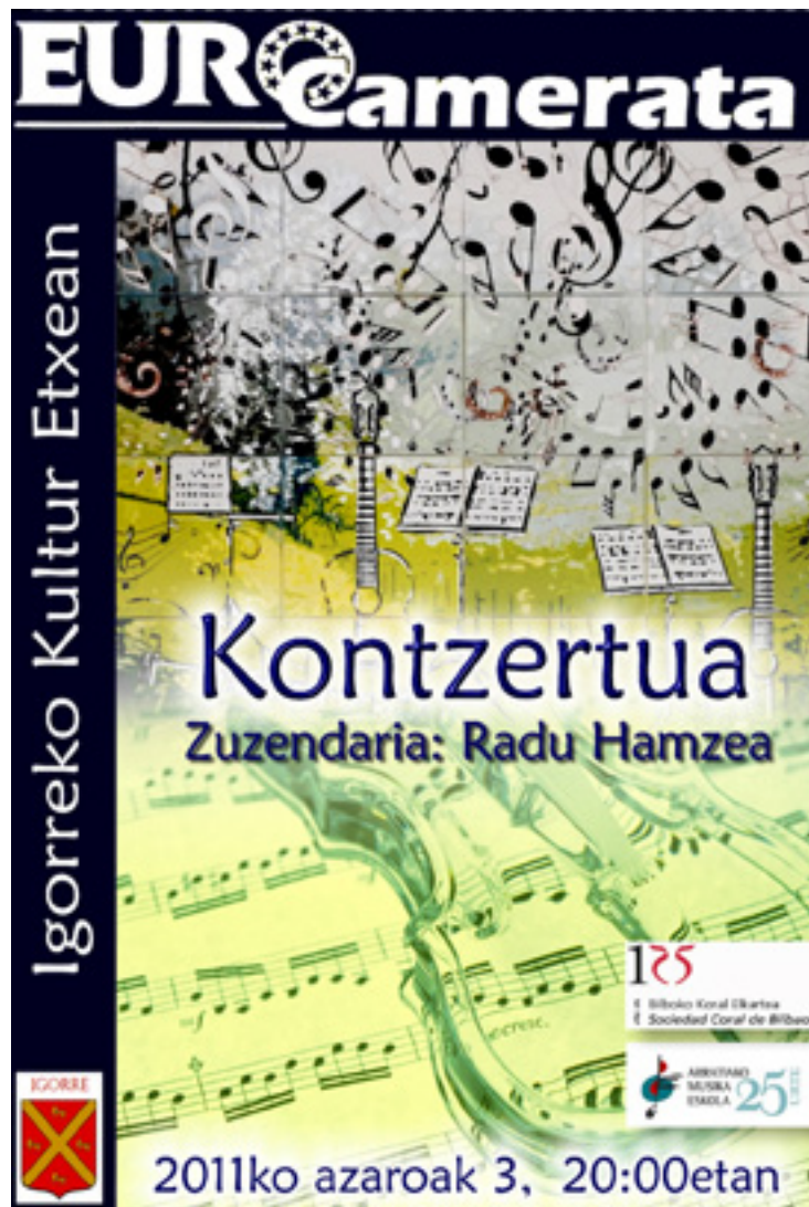
EuroCamerata orkestraren kontzertua iragarten dauan kartela.

Zemendiaren 3an, Arratiako Musika Eskolea eta Bilboko Koralelkararen eskutik, EuroCamerata orkestrak kontzertua eskeiniko dau Igorreko Kultur Etxean, arrastiko 19:30ean.