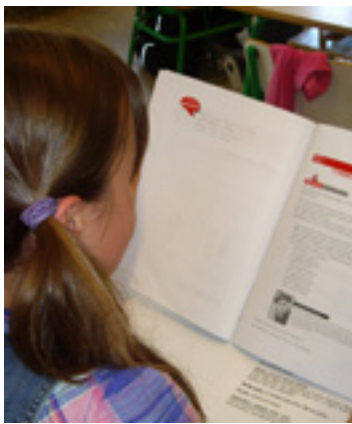
Bertsogintzea landuko dabe Arratiako ikastetxeetan.