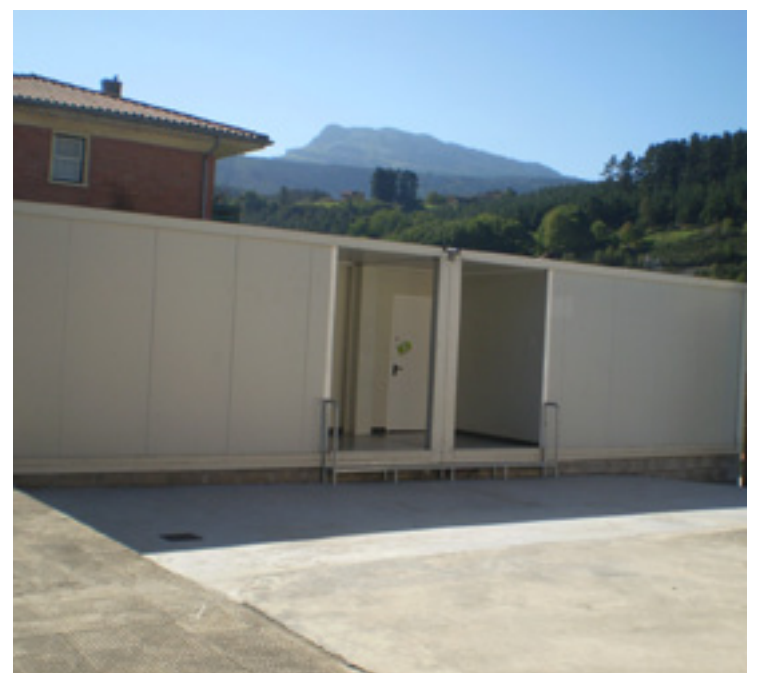
Ikastetxearen ondoan ipinitako barrakoaia.