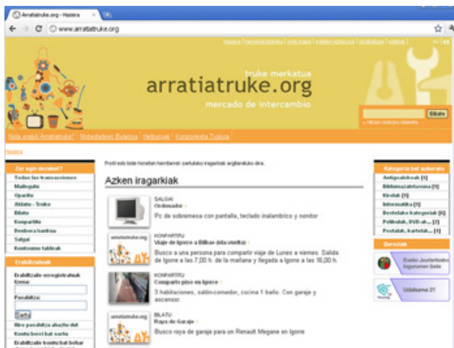
Mankomunidadeak martxan ipiniko dauan webgunea.