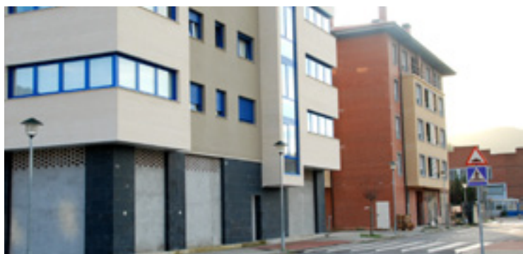
Errekaondoko promozinoko etxeak.

Baldintza orriak eta eskabideak bedia.bizwebgunean eta udaletxean bertan dagoz eskuragarri.