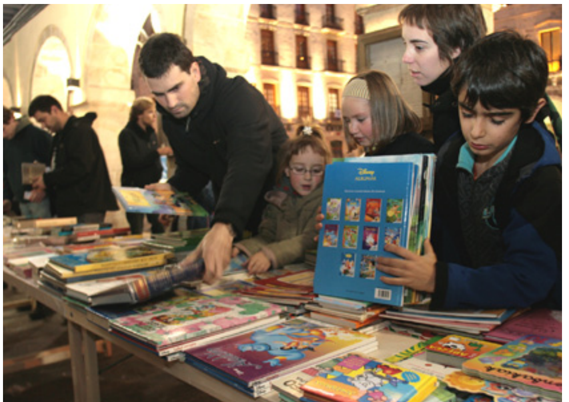
Truke azoka bat.

Denpora bankuetan, denpora kronologikoa da balio unidatea