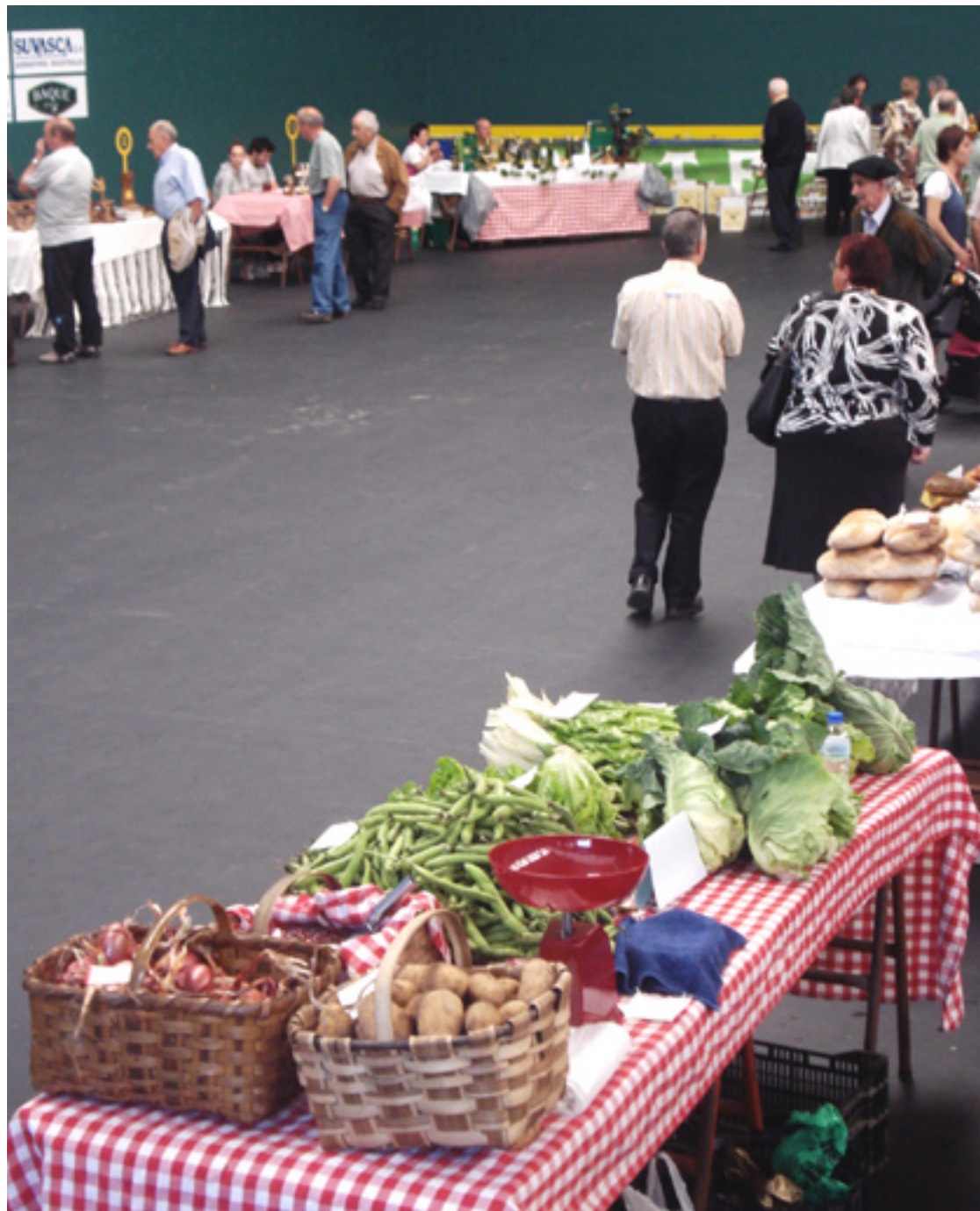
Baserriko produktuak konsumo taldeak gestionaiko ditue.

da unidate horrek ahalbidetzen dauala jarduera guztiak bardin balio izatea, baina horren azpian dagoana zera da: naturalizatu egiten