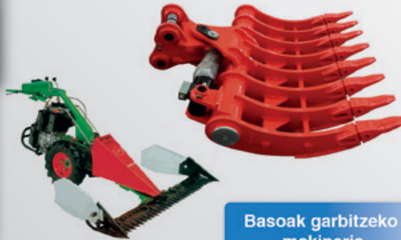
Basoak garbitzeko makineria