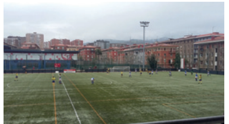
Andrazkoen Arratia taldeak San Ignacioren kontra jokaturako partidua.

Datorren partidua hilaren 1ean, 12:30etan, jokaturako dabe Lemoakoak Arlonagusian Mungia A taldearen kontra.