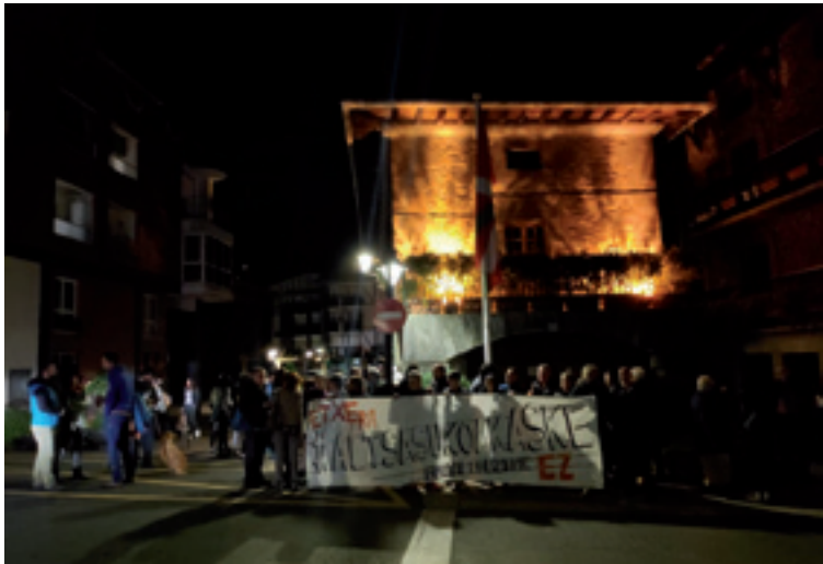
Zeanurin batutakoak Altsasukoak aske ixteko eskatuten.