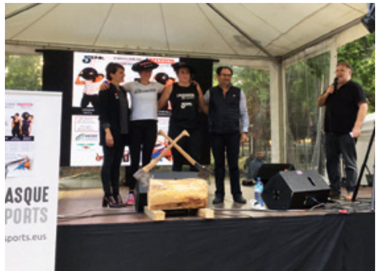
Astondoa eta Gisasola txapelakaz.

Herri kirol pentatloiairen palmaresa andrazkoetan inaugurau dabe kirolari bizkaitarrak.