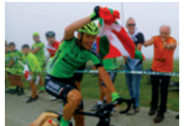
Murias taldeko txirrindulari bat Oizen gora Espainiako Vueltan.