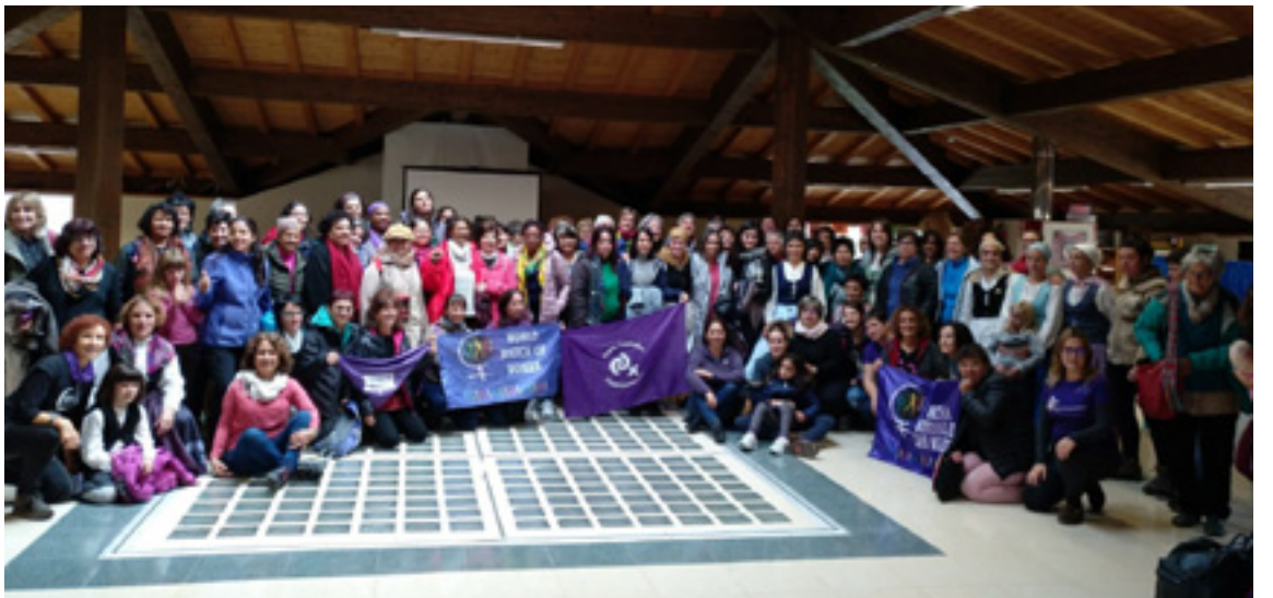
Emakumeen Mundu Martxako kideak eta arratiarrak Diman.

Bazkariak eta ondorengo jantzialdiak emon eutsien amaiera egunari.