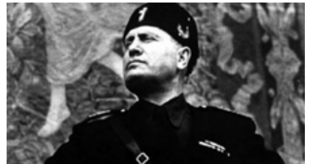
Adolf Hitler goian eta Benito Mussolini behean.