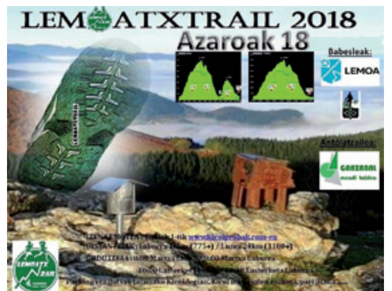
Lemoatx Traileko kartela.

Proba amaitutakoan, parilladea, garagardao dastaketea eta kirol materialaren zozketea egingo dira.