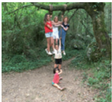
Mamarro filmako protagonistak.

Areatzan zehazkiaren 27an, udaletxeko Areto Nagusian eta Igorren, zehazkiaren 20an, Lasarte Aretan ikusi ahal izango dira.