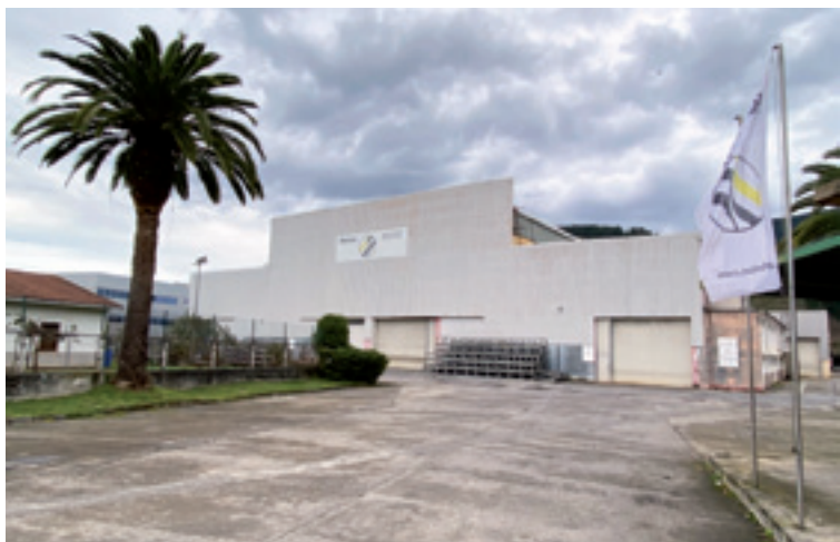
Kelvion enpresea, 2015era arte GEA izandakoa.

Kelvion Thermal Solutions-ek beste lantegi bi daukaz Estaduan; bata Kantabrian eta beste bat Madrilan eta kaleratze kolektiboaren ebatziak 3 lantegiai eragiten deustie. Guztira 147 behargineri.