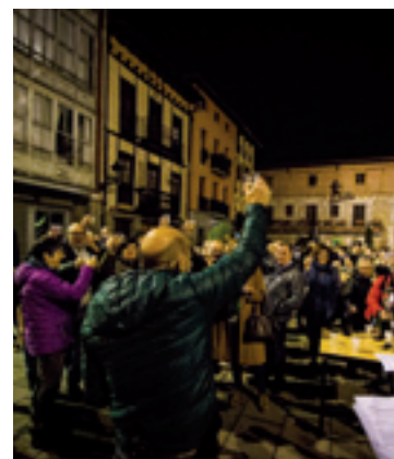
Ekitaldi osteko brindisa.

gotziak Euskal Herria nazinoa dala, Euskal Herriak bere etorkizuna erabakitze eskubidea daukala eta euskal herritarrai jagokiela ebatzia hartzea aldarrikatu eben.