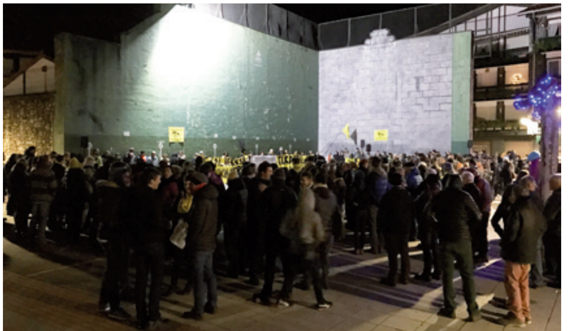
Abenduaren 29an Zeanuriko plazan egin zuen konzentrazioa.