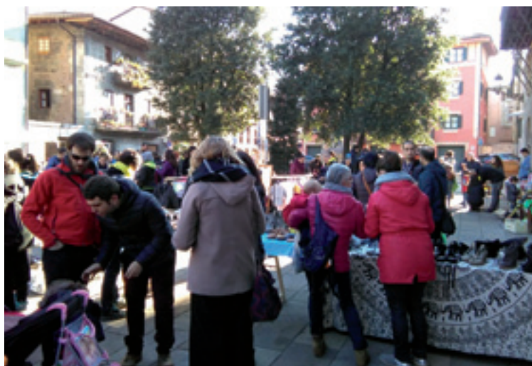
Errefujiaduen aldeko bigarren eskuko azokea Areatzan.

Gurutze Gorriak be balantze positiboa egin dau, nahiz eta Arratian behar izan diran jostailu kopurua beteteko, Bizkaiko Gurutze Gorritik zenbait jostailu ekarri behar izan diran. Aurten 76 ume jaso dabe jostailuren bat Arratian. Dana dala, "beti legez, arratiarrak solidarioak dirala erakutsi dabe" Arratiako Gurutze Gorrikoen esanetan.