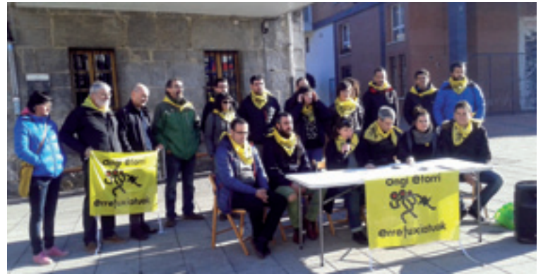
Arratia eta Zeberriko EH Bilduko alkate eta zinegotziak Zeanurin.