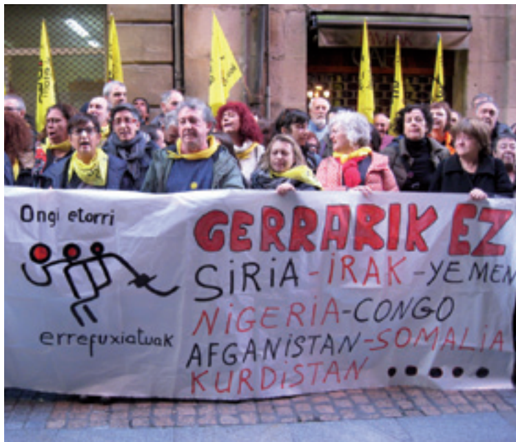
Atxilotutako biharamunean Bilbon egindako konzentrazioa.

naren gainean, baikor egozan batutakoak eta, batez be, Europaren politikak salatu eta errefujiaduak alkartasuna adierazo eutseen konzentrazioetan. Konpromiso bi hartu ebazan OEEk: mugak zabaltzea legaltasun barrian edo desobedientziaren bidetik eta gure herria persona guztientzako harrera herria izan daiten lanean jarraitutea, hain zuzen be.