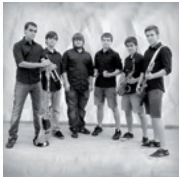
Guda Dantza taldea.

17:30ean, Erregetako Kabalgatea Karpotik hasita. 23:00etan, kontzertuak Gazte-txean. Neke Politikoa eta Guda Dantza taldeak.