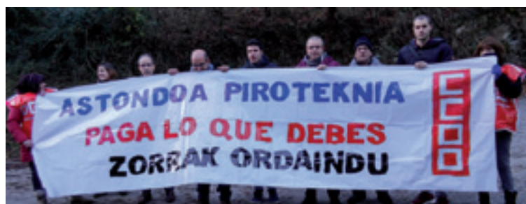
Abenduaren 29ko konzentrazioa Piroteknian aurrean.

Beharginak sasoi honetan, salmenta asko egiten dirala aprobe txau gura izan dabe euren eskakizuna heldu arazoteko.