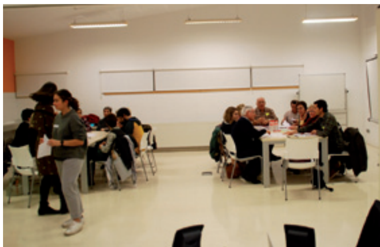
Bizi Batzordeko batzarrera hurreratutakoak.

Bizi Batzordekoak zera adierazo eben: "dinamikean, proposatutako arazoez beste taldeetako jentek zer uste eban jakin gura