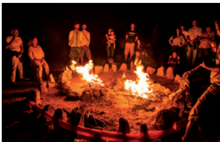
Neguko solstizioko gauean egindako suak.

Hasteko, solstizioa zera da: gure kasuan, ipar hemisferioko ardatzerdi baten inklinazio axialik handiena harturik, Lurra planetak Eguzkia izar handirantza orbitatzen dauanean gehien makurtuten dan unea. Neguko solstizioaren fenomeno astronomikoa abenduaren 20-23 egunen inguruan izaten da.