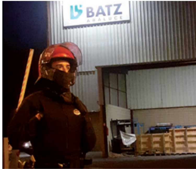
Abenduaren 27ko operatiboaren irudi bat.

Zemendiaren 8an greban hasi ziranetik, Batz-Araluceko beharginak atxikita euki dabe materiala protesta moduan, baina Bilboko