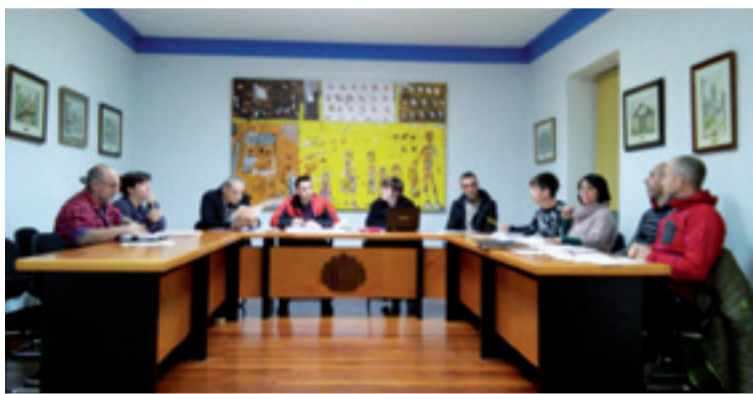
Aurrekontuak onartu ziraneko plenoko irudia.

EAJ-PNV eta Dime Aukeraturen (DA) aldeko botoakaz eta EH Bilduren kontrakoakaz, abenduaren 18an, 2020rako aurrekontuak onartu ziran behin-behinean. Udalak 1.693.250 euro kudeatuko ditu.