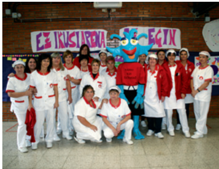
Eskolako jantokiko hezitzaileak Harrotxugaz.

geure hizkuntzan berba egiteko. Jente guztiagaz saiatu behar gara euskeraz berba egiten, eta harro sentidu behar gara horrexegaitik.