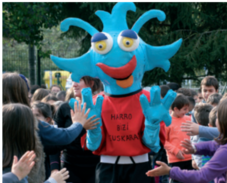
Lemoako eskolako umeak Harrotxugaz.

Harrotxu sortu zan, gure artean euskeraz berba egin dagigun. "Harro", bildur eta lotsa barik