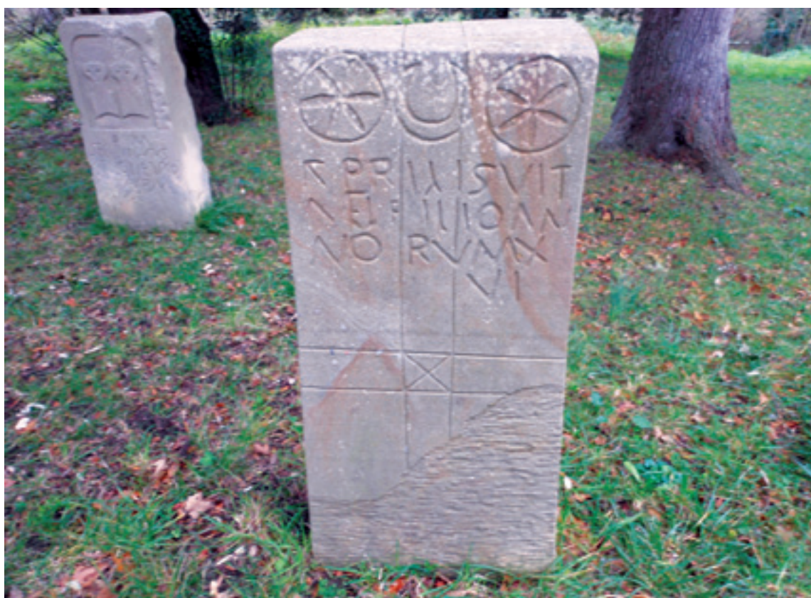
Elorriagako hilariak (benetakoak Bilboko museo arkeologikoan dagoz). I. eta III. mendeen arteko, irudi "indigenakaz" eta epigrafe latindarrakaz.

Lemoako Elorriagako aztarnategiak kultura "indigena" batez eta erromanizazioaren zantzuez berba egiten deusku. Beharbada beste egoera linguistiko eta kultural batez berba egiten deusku Arratiako historia zaharrerako