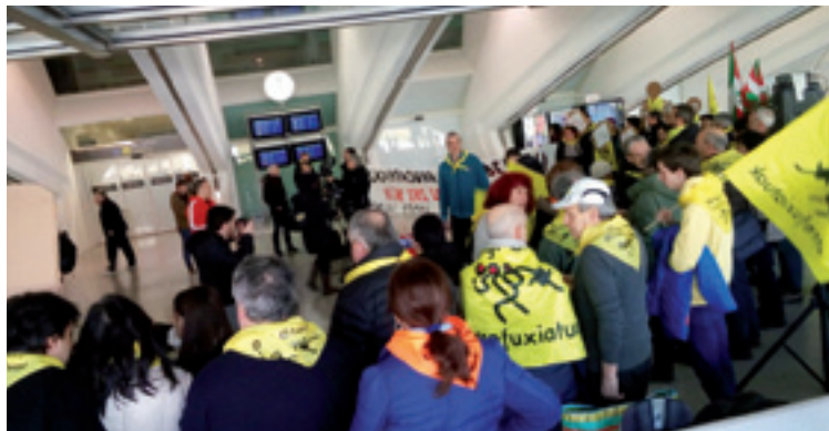
Zuluaga eta Huarteri harrerea Loiuko aireportuan.