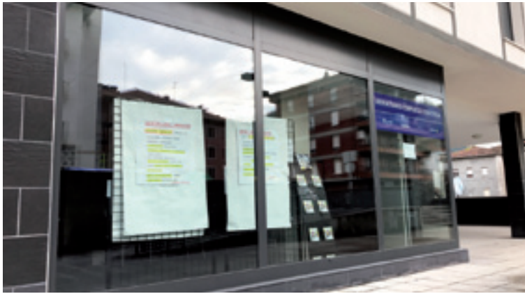
Areatzako enplegurako orientazio bulegoa.