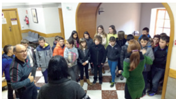
Areatzako ikasleak udaletxean.