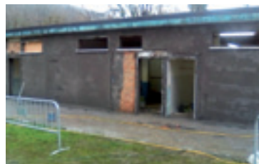
Errugbi zelaiko aldagelak.

Lanak ABI enpreseari adjudikau jakoz, 39.665,56 eurotan.