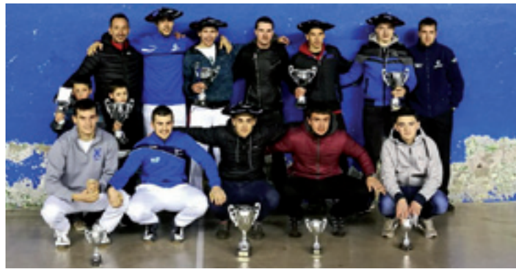
Finaletan parte hartutakoak.

Igaz baino jente gitxiago egon zan finalak ikusten, baina maila oneko partiduak izan ziran eta antolatzaileak balorazino positiboa egiten dabe kirolaren alde-tik.