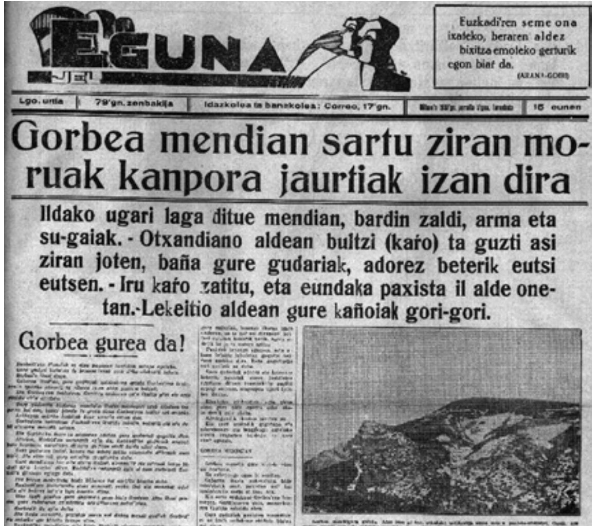
1937ko maiatzaren 3ko Eguna egunkaria.