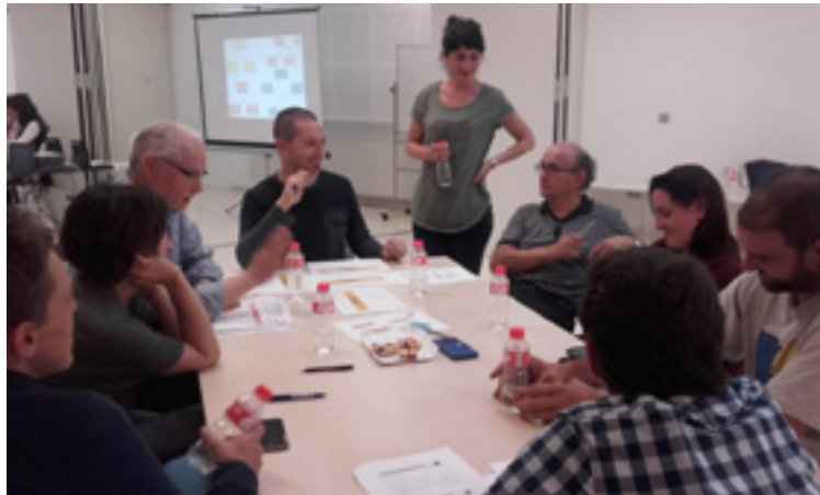
Errotaren talde dinamika bat.