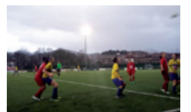
Berriozarren kontrako partidua.

Arratia B taldeak 4-0 irabazi eutsan San Antonio taldeari jokaturako atzen partiduan. Holan, 14. jardunaldiaren ostean, 8. postuan dago 20 puntugaz. Hurrengo partidua Igorren jokaturako dau Otxarkoaga B taldearen kontra 21-22ko astegoienean.