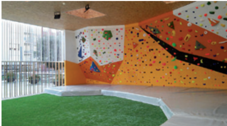
Zabalik dago boulderra barriz.

Urteagaz batera, urtailaren 2an zabaldu ebazan ateak Igorreko boulderrak, barriro be eskalada zaleai herrian eskaladea praktiketako aukerea emonaz.