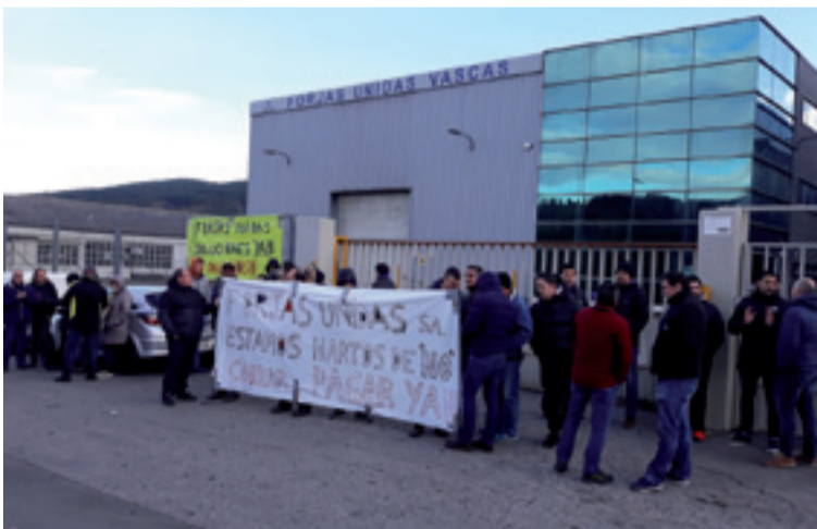
Forjas Unidaseko langileak protestan.