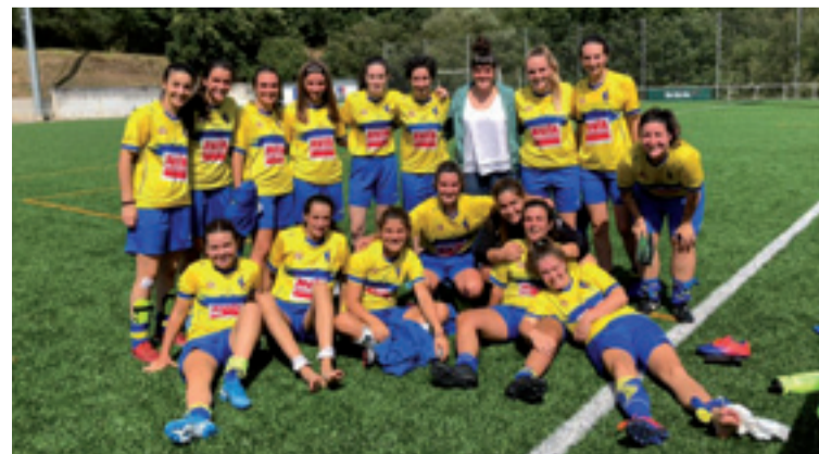
Arratia B taldea.

Hamasei jardunaldiren ostean hamabigarren postuan dago LemoaHarrobi 18 puntugaz.