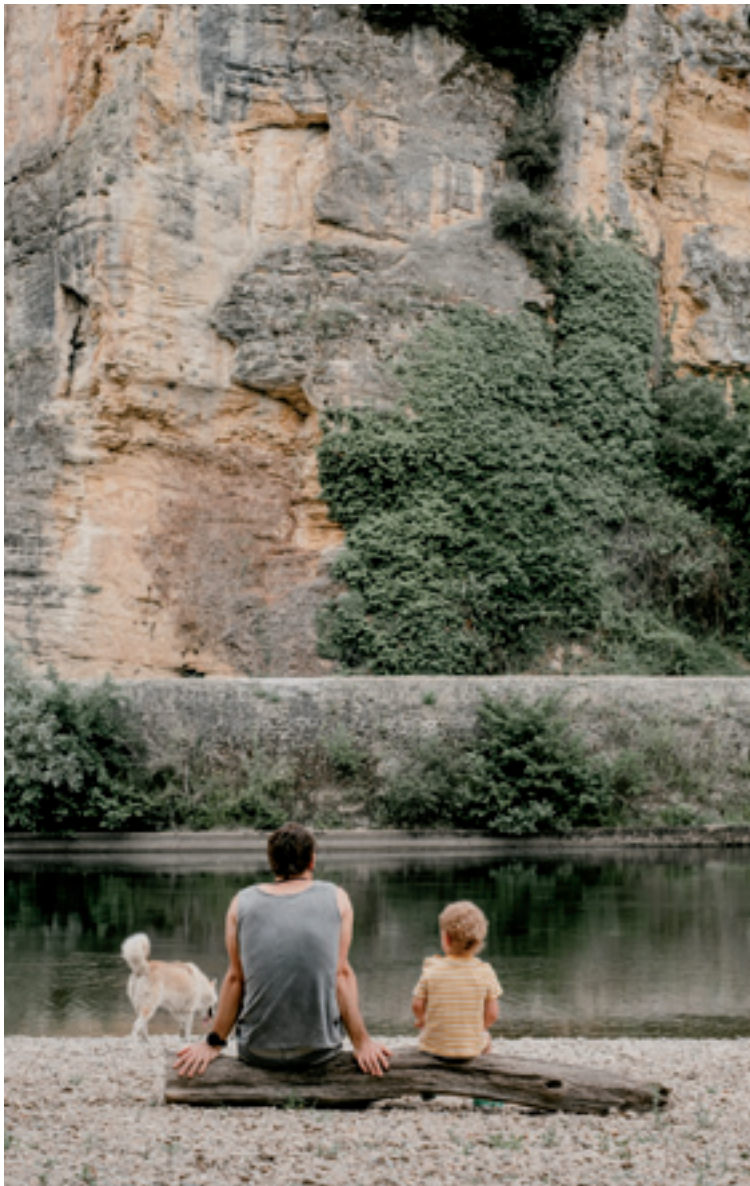
La Roque-Gageac. Deiene Gurtubaik Dordoñan ateratako argazkia.