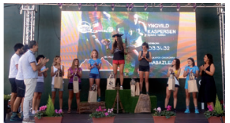
Gizonezko eta andrazkoen podium-ak.