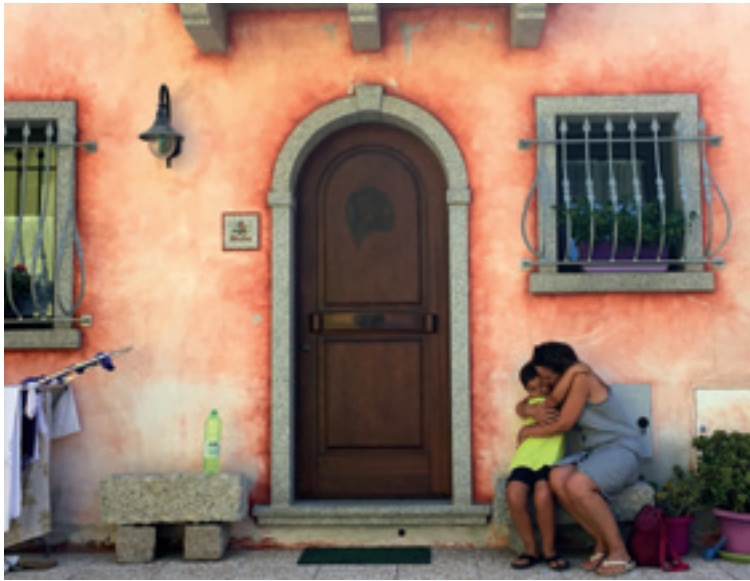
Nik be bai zu. Joseba Rodriguezek ateratako argazkia Santa Teresa de Galluran.