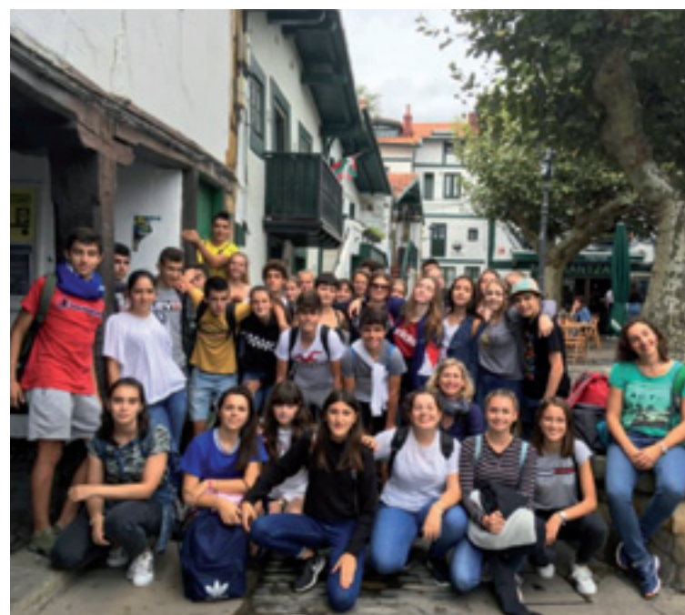
Arratia Institutukoak alemaniarrekaz.