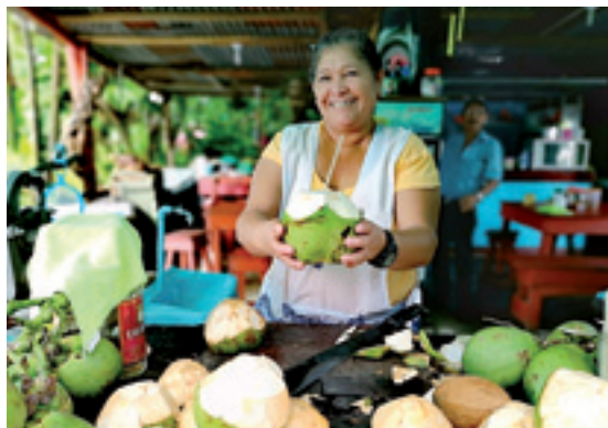
Kokoak. Miren Urutxurtuk Costa Rican aterata.