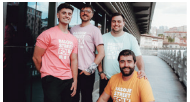
Kittu taldeko kideak.