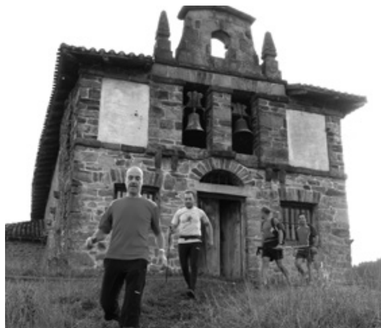
Altzuetako San Migel.