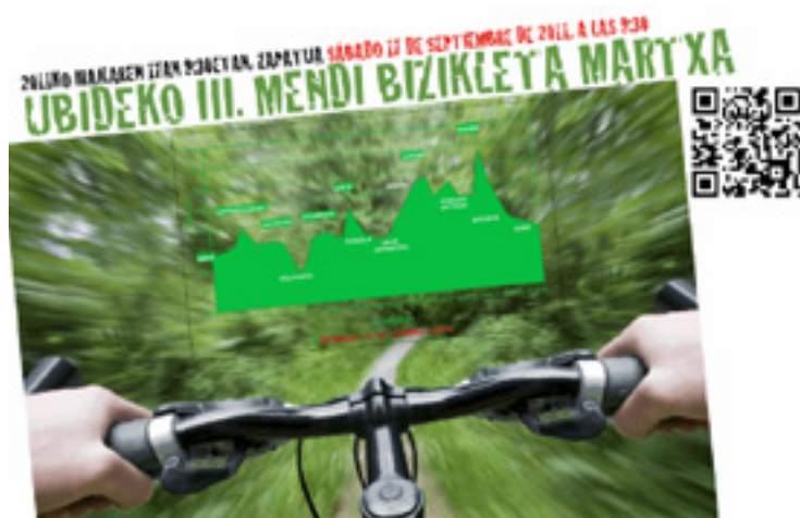
Ubideko mendi bizikleta martxarako izen emotea zabalik dago.

Gehienez 200 partaide izango dira eta guztientzat horniketea, dutxa hartzeako aukerea eta oparia egongo dira. Zozketea be egongo da.