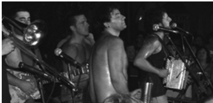
Los zopilotes txirriak taldekoak.