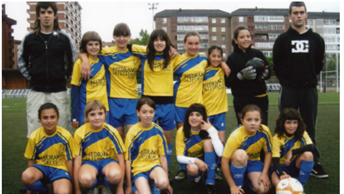
Arratia futbol taldeko kimuak.

tek pentsau eban neska talde batek jente gehiago eroango ebal futbola ikustera eta holan zorrak kendu ahal izango ebalala taldeak. Halan-txe izan zan, ze pronostiko guztien kontra, urte haretako Bizkaiko neska talderik onena izan zan C.D. Arratia "Soberano" taldea" azaldu eutsan BEGITURI orain dala hiru urte talde honen sorreraren lekuko batek.