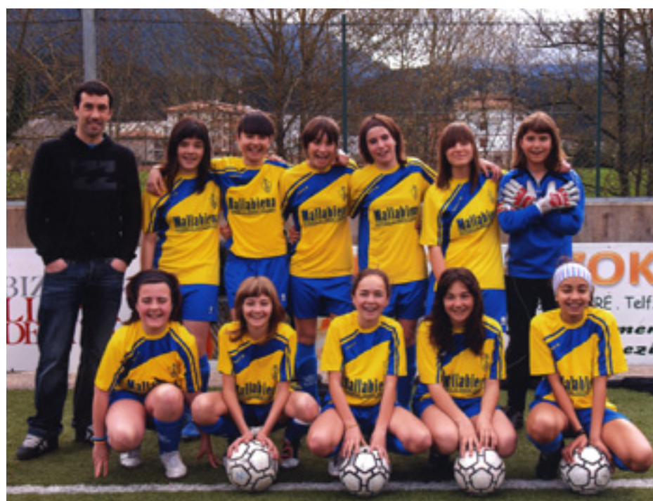
Arratia futbol taldeko haurrak.

Kantereak taldea egonkortzen lagunduko dauala uste dabe jokalariek, isolatuta eta jokari faltan beti desagertzeko arriskuan ez egoteko. Neskentzat ez da nahikoa eta, futbolari onak izatea futbolearen jokatu ahal izateko. Horren adibide da Arratia futbol taldearen historia bera. 1969an Arratia C.D. Soberano, neska taldea sortu zan eta bere historia osoan partidu bakarra galdu arren, urtegarrenean desagertu zan entrenatzaile-rik ez eukalako. 8. eta 9. orrialdeak