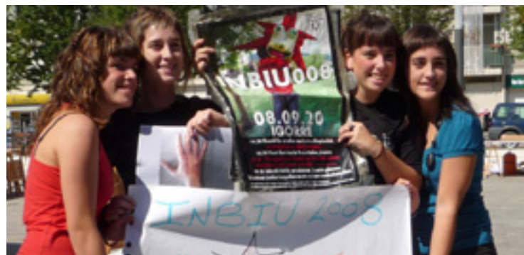
Igorreko gazteak 2008ko INBIU egunean.

Eguerdian, jaialdiari jarraipena emoteko herri bazkaria egingo da Lasarte plazan edota euririk egin ezker, eskolako aterpean. Bazkarirako txartelak salgai egongo dira Kiroldegian, Gau Loran, AZ Rugby Tabernan, Axular herriko tabernan eta Batzokian hamabost euroko prezioan. Arrastian, 17:30ean, AMEk (Arratiako Merkatarien Elkar- teak) antolatuta, Jokaldi taldeagaz erromeria egongo da. Eta jaia amaituteko, 21:00etan txokolatea eta bizkotxoak egongo dira Beinkek, Igorreko Merkatarien Euskera Taldeak, emonda.