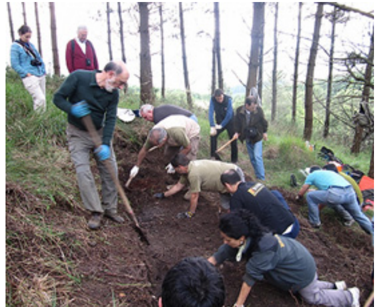
Aranzadi alkartekoak Lemoan beharrean.

moria historikoa berreskuratzeko lanetan, ez dau bakarrik Gerra Zibileko deshobiraketak egiten, gerra eta gerra ostean desagertutakoak be bilatzen ditu, artxiboak arakatu, testigantzak grabatu eta beste lan asko.