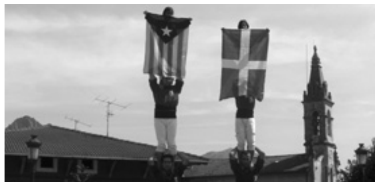
Castellersak orain dala urte batzuk Artean.