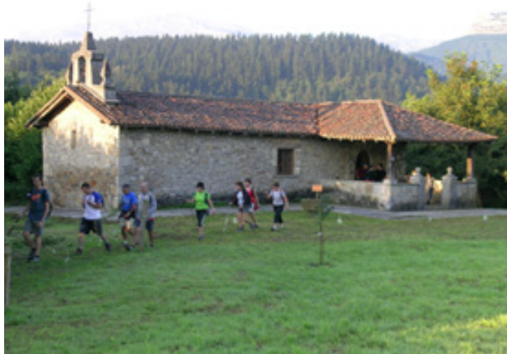
Zeanuriko ermiten ibilaldian parte hartzaileak.