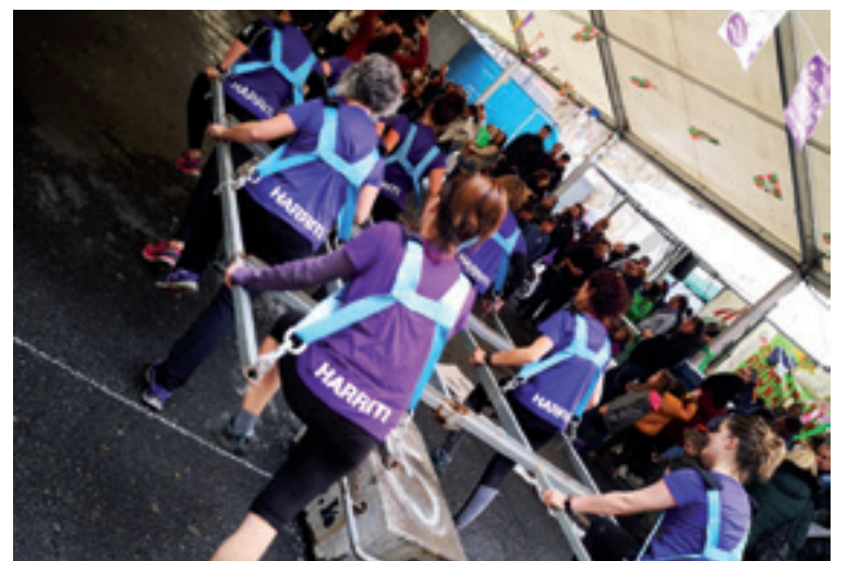
Harriti taldea.

Harriti 2013an sortu zan. Andra talde sano gitxi dagoz Euskal Herriko harriari tira egiten deutan eta Bizkaian bakarra.