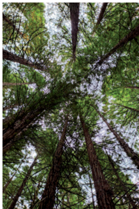
Sekuoien basoa. Ainara Olazabalaga.