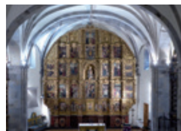
Zeanuriko Andra Mari eleizako erretratu nagusia.

Ikusmira Ondarea enpresako kidearen eskutik. Parte hartu