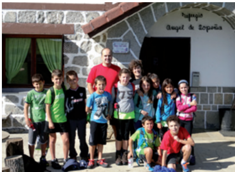
Zeanuriko 5. mailako ikasleak Gorbeian aterpean.