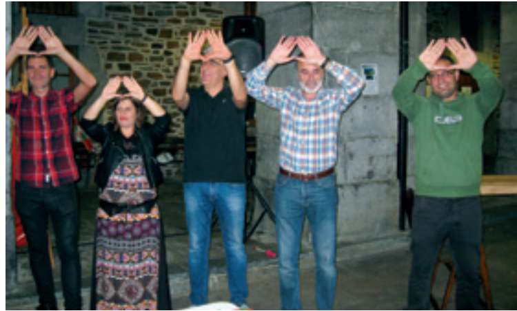
Igorre, Lemoa, AUMeko presidentea, Zeanuri eta Areatzako alkateak.