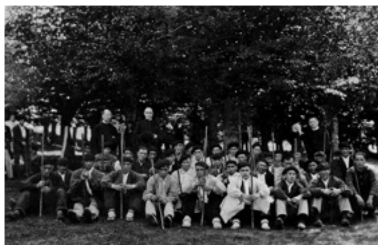
Gorbeiaiko artzainak, tartean Ubide eta Zeanurikoak, Igiriñan.

Ibilaldiaren ostean, 13:00etan, Ubideko eta Zeanuriko zinegotziak batzartu egingo dira Ubideko udaletxean, eta gura dauanak 10 bat minutu irauten dauan batzarrean egoteko aukerea izango dau; bilera horretan idazkariak udalerrri bakoitzean izena emon daben abelburuen zenbakiak aurkeztuko dabez, eta bilera-agiria sinatu ostean, danak batera bazkaltzera joango dira. Datorren urtean gauza bera egingo da, baina Zeanuriko udaletxean, eta bazkaria ordaintzea be zeanuriztarrei egokituko jakie.