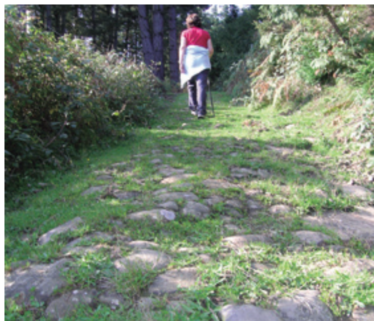
Oindino mantendutena dira Gasteiz eta Bilbo lotzean zituan Errege Bidearen tarte bat.