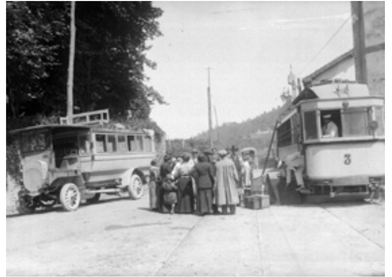
Arratiako Tranbia Zeanurin.

Partaideak Areatzako alde historikoko kaleetatik eta bes-