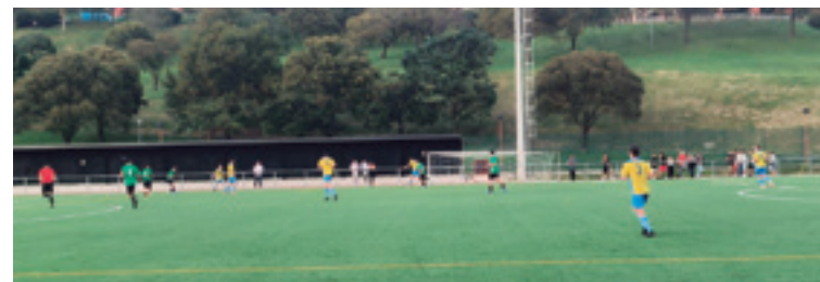
Sestao River B eta Arratia Aren arteko partidu.

Lemoako Harrobik partidurik irabazi barik segiduten dau eta hilaren 12an La Merced A taldearen kontra Arlonagusian jokatu dau partidu bina bardindu eban. Aurreko partidu bana bardindu eban etetik kanpo San Miguel taldearen kontra. Lau jardunaldiren ostean puntu bi ditu Lemoako taldeak eta jatsiera postuetan dago. Datorren partidu etetik kanpo jokatu dau Loiola Indautxu taldearen kontra hilaren 20an, 19:30ean.