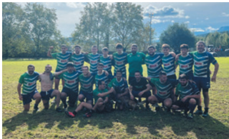
San Txisme zelaian Arratiko Zekorrak.