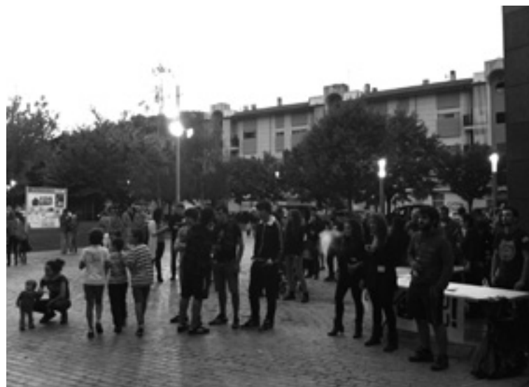
Aurkezpena hurreratu zan jentea Lasarteko plazan.