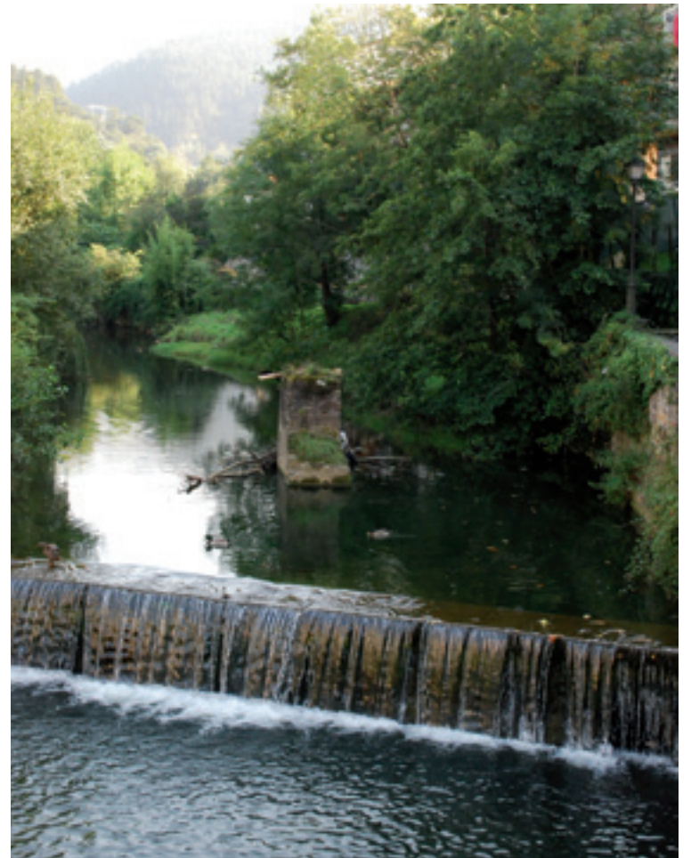
Errekako baztarreko obrak hasi dira.

Plan honen helburu nagusia uriolak eta horreen kalteak prebenidutea da. Areatzan uriolak urigune historikoa kaltetzeko arriskua dakarre: hain zuzen be, urez gaineztatzeko Errukiñe eta Gudarien Plaza; eta Bekokaleko eraikinen atzeko partek hondoratze arriskua daukie "zimendatze faltagaitik" udaletik jakinarazo dabenaren arabera. Hori ebitatzeaz gain, lan honek,