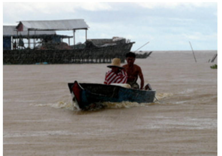
"Urgaineko herria". Jagoba Etxezarraga.