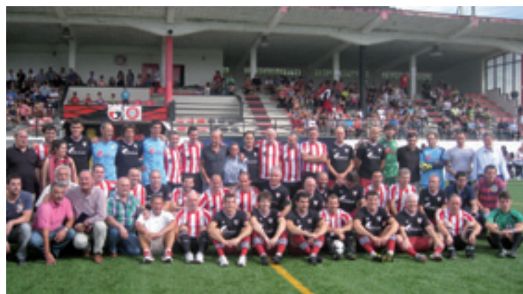
Arlonagusia inaugurazioan jokalariek eta udal ordezkariak.

Urri lehenengoaren 28an, Lemoako Arlonagusia futbol zelaiaren inaugurazio ekitaldia izan zan, udan birmoldaketa lanak egin eta gero.