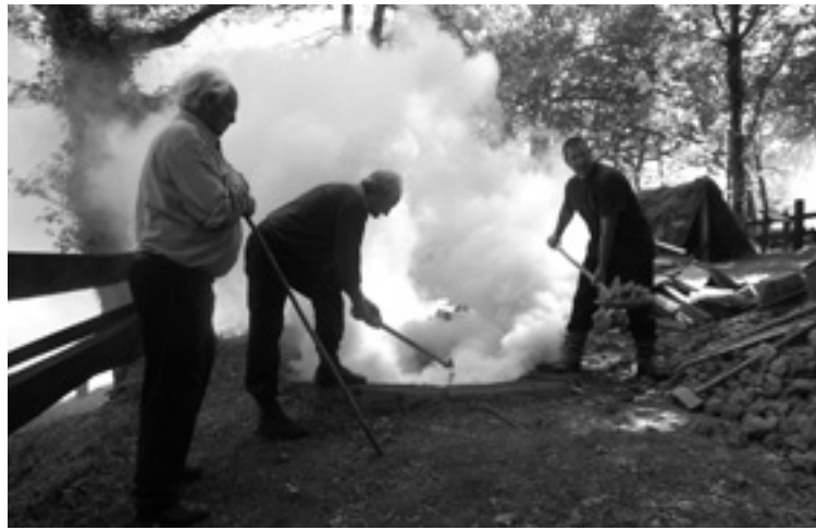
San Justoko karobia.

Aldaketak izan dituan ondarearen beste adibide bat Igorreko Andra Mari eleizea da. Eleiza hau XVI. mende hasieran berregin zan osorik eta XVIII. eta XX. mendeetan handitu. Azken urteotan beste esku hartze bat izan dau baina oraingoan erispide konserbadoreak erabilia: indusketa arkeologikoa egin zan lehenengo eta gero ba-