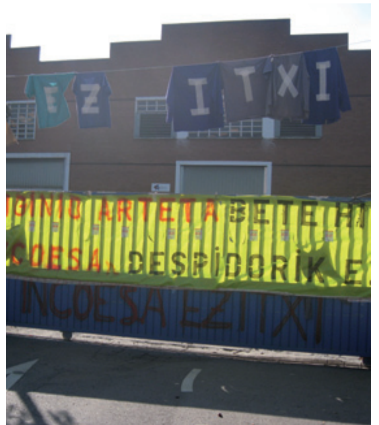
Incoesa enpresako ataria.

Deslokalizazioa ez gertatzeko neurriak hartzeako eskatzen