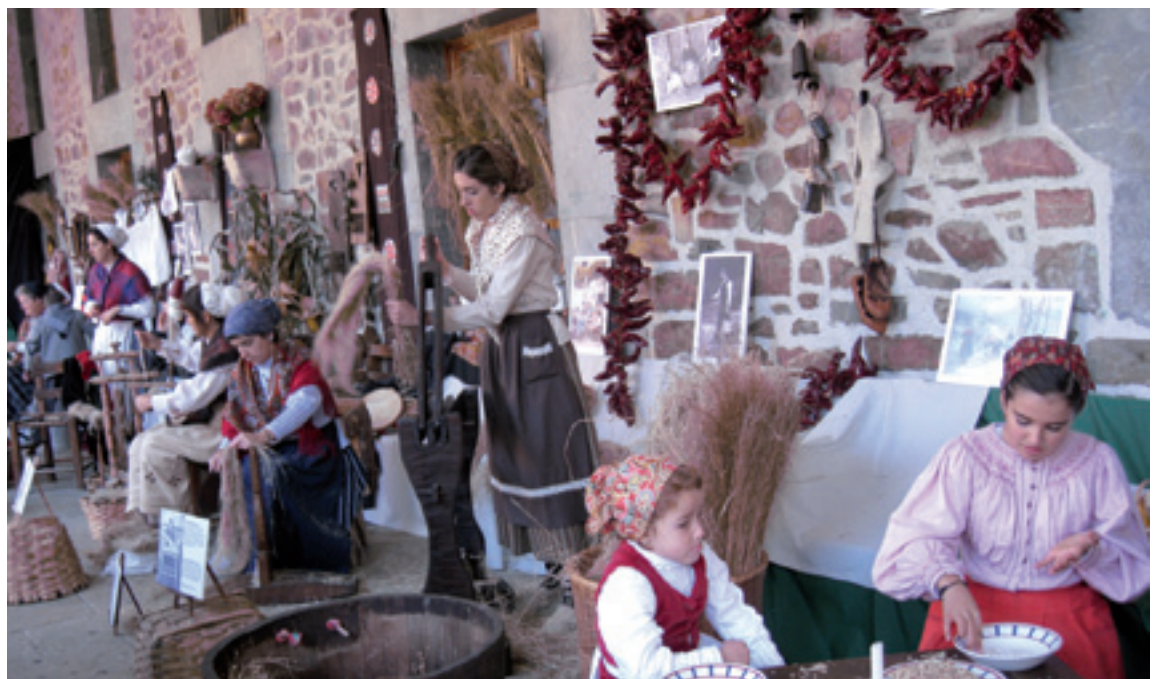
Areatzan Euskal Jaia izango da urri bigarrenaren 5ean.

Jaia, hilaren 5ean; Igorreko Andra Mari Eleizea ezagutzeko bisita gidatuak, 26an; Ubide-Zeanuri Larreen Mankomunitatearen Zeharkaldia eta ondorengo zorrak kentzeako bilkurea, 26an hau be; San Justoko karobia eta Olabari errotara bisitaldia hilaren 5ean; Zeanuriko kofradietatik ibilbidea, hilaren 12an eta Zeanuriko Eleizondo monumentu multzoari bisita, 19an, dagoz Ondarearen Jardunaldietan. 12. orrialdea