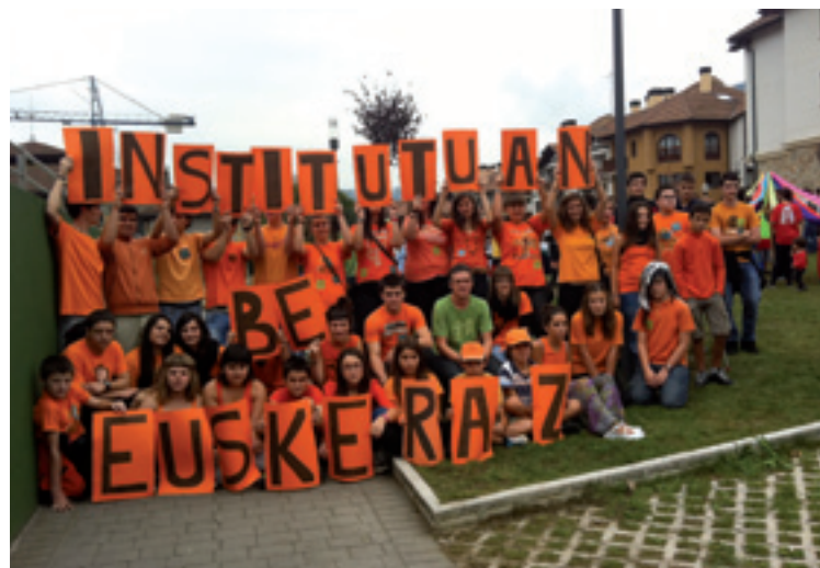
Institutuko ikasleak Inbiu Egunean.

Portugaleten ospatu zan Ibilaldian hain zuzen be, antolatzaile batengana joan euskeraz, eta berak "¡Hablame en castellano, por favor!" esan euskunean. Ibilaldia ez da egiten euskerea bultzatuteko asmoagaz, ala?