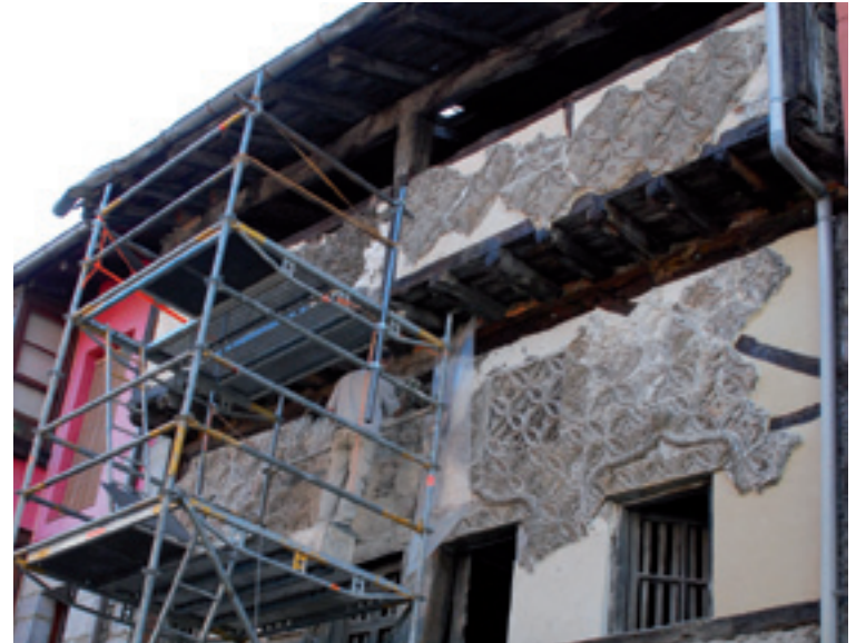
Etxe mudejarra barrizatzen dabiz Areatzan.

esan daiteke, "igeltsu mudejarra" erabiliko neuke" dino Larreak.