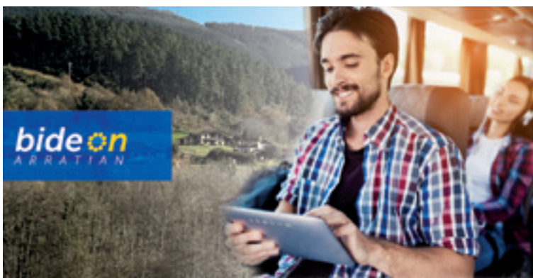
Urtailean ipini zan martxan BideON kanpaina Arratian.

Eskaerearen araberako garraio zerbitzua, ikasleak Deustuko Unibertsitatera, Sarrikoko Ekonomia eta Enpresa Fakultatera, Bilboko Ingeniaritza Eskolara eta Mondragon Unibertsitateko Bilboko Campusera eroaten hasi da. Hasikeran, unibersidadeko ikasleei egindako eskaintza, etxeko atetik hurreneko garraio publikora zan.