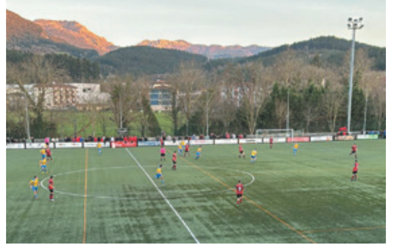
Arratia B eta Lemoako Harrobiren arteko derbia.

fuerte A taldearen kontra martiaren 2an, arrastiko 16:00etan.