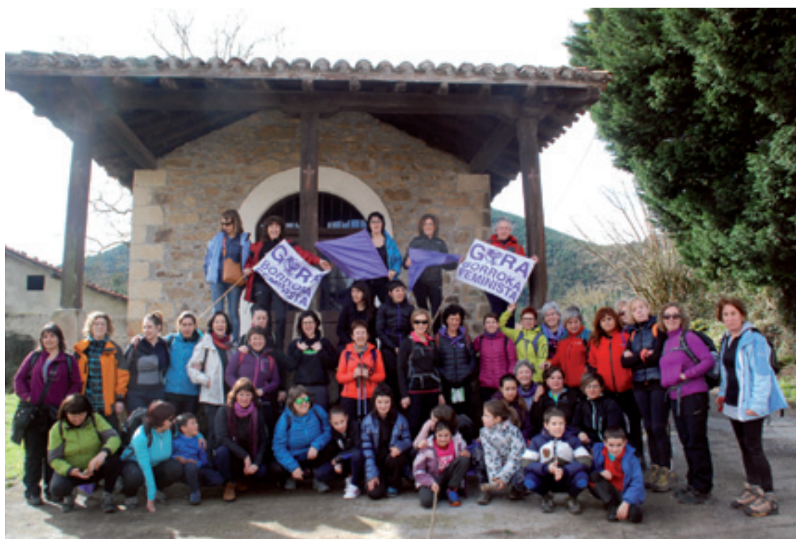
Igazko mendi martxako irudia.