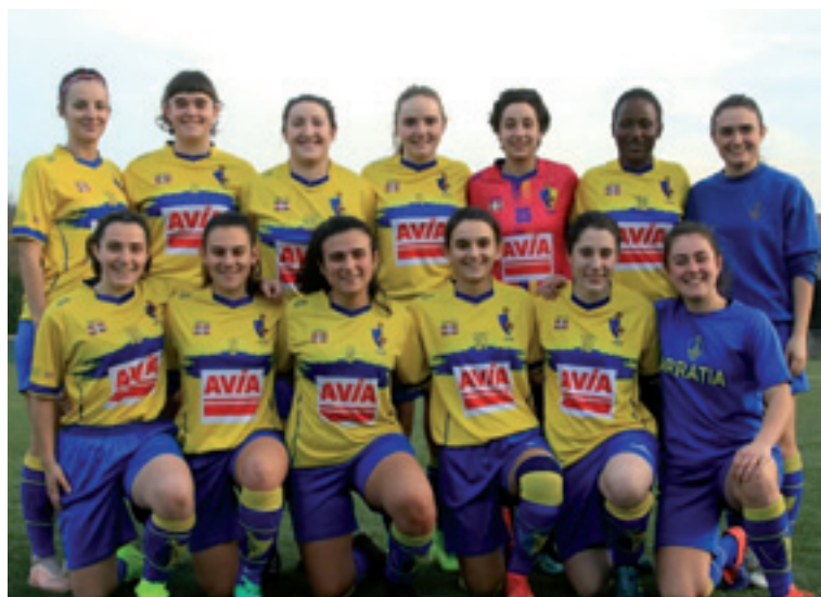
Arratia B taldea.

Arratiako futbol taldeak nahiko denporaldi ona egiten dabiz orokorrean. Arratia اندرازkoen A taldea bigarren postuan dago barbarako, gizonetzkoena ostera nahiko eskas dabil eta sailkapenean atzeko postuetan dago.