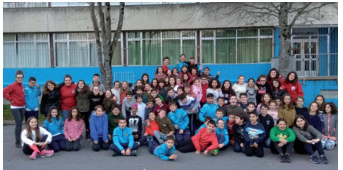
Alkarregaz egitasmoa gazteak Arratia Institutuan.

Arratiako Gurutze Gorriaren Alkarregaz egitasmoak Lehen Hezkuntzatik DBHra doazen ikasleak etapa aldaketa horretan laguntzea eta Arratiako nerabeen arteko hartu-emonak sortzeko jaio zan.