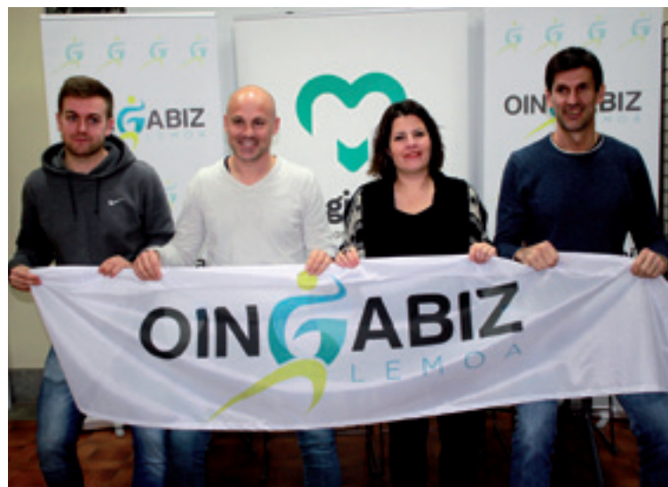
Lemoako alkatea, Jaurlaritza, Aldundia eta Oingabizeko ordezkariak.

nean dago eta debaldeko zerbitzua da. Ordua alde aurretik hartu behar da oingabiz@lemoa.net helbidera idatzita edo 94 631 30 05 telefonora deituta.