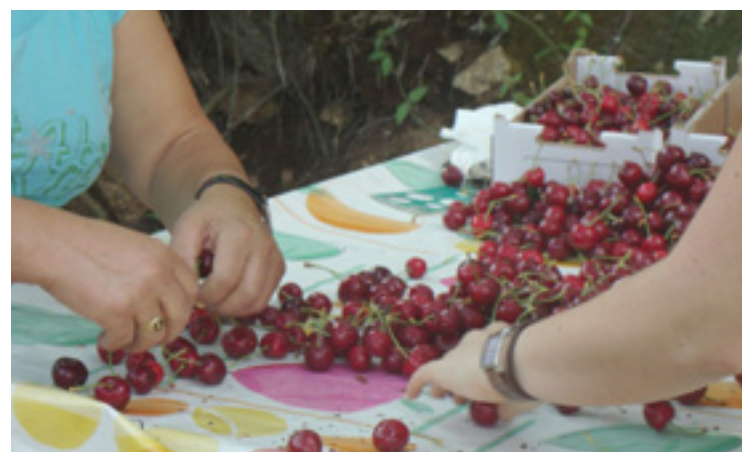
Andra baserritarrak beharrean.

Etxalde nekazaritza iraunkorrerako mobimentuak Euskal Herriko andra baserritarren lehen topaketak antolatu ditu Arratian martiaren 8aren inguruan, "Baserritar jakinduria eta teknologia" titulupean.