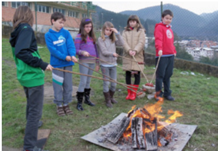
Umeak txorizoa erretzen.