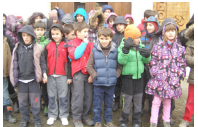
Zeanuriko ikasleak museoan.

Oso ondo pasau genduan eta gauza asko ikasi be bai.