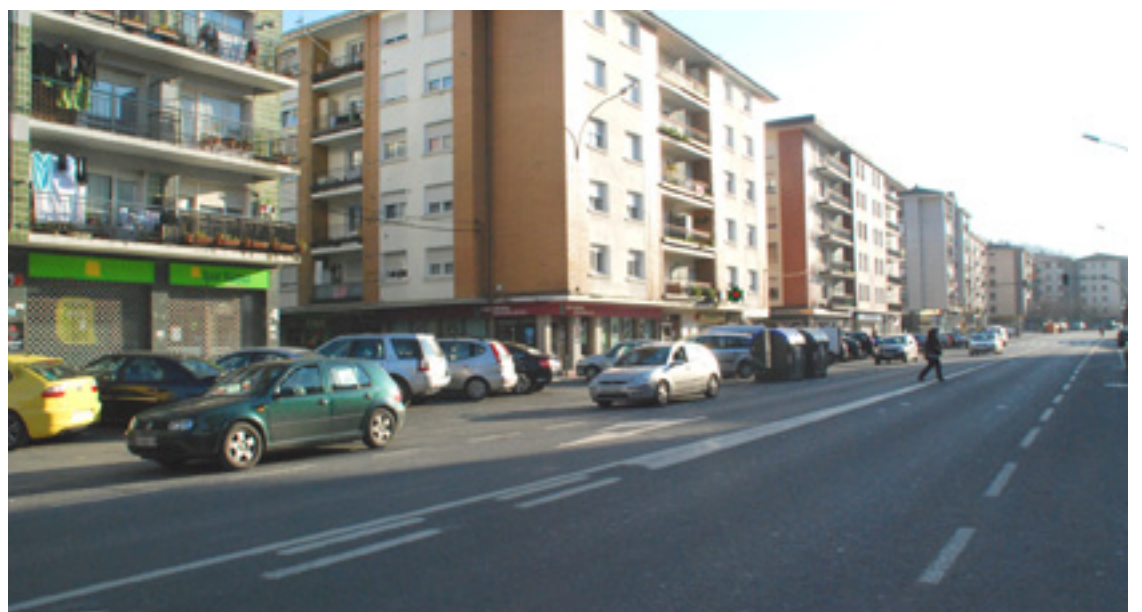
Autoak sarri txarto aparkauta egoten dira Agirre Lehendakaria kalean.

Bigarren lerroan aparketea be zuzendu beharko ohitura horreen artean dago.