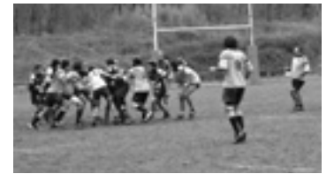
Zekorrek partidu baten.

Gaztetxoak barriz, azkeneko postuetan dagoz. Ez dabe partidurik irabazi. Riojan izan eban azkeneko partidua, eta aste biko atsedena daukie Zekortxuak.