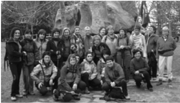
Igaz egin zan I. Mendi Martxako argazkia.

Bigarren honetan be igazko giro ederrean eguna pasatea espero dabe antolatzailak.