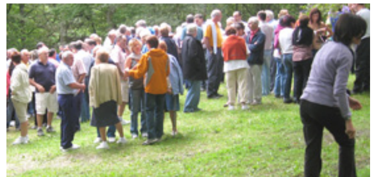
Senbilizazio kanpainak be egin dauz Caritasen.

Egoera administratiboari begira, Caritasen egoera ez normalizatua dabenak lagundu ditu ge-