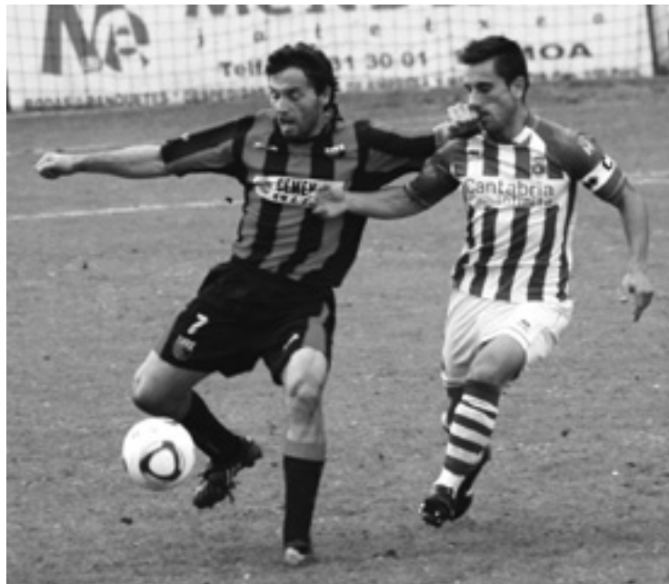
Lemoa etxeko partidu baten.