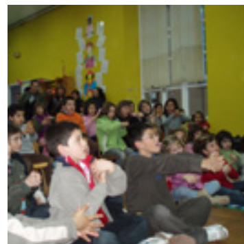
Umeak sari banaketan.

3. saria: Gregore Iuga / "Bizitza Marten".