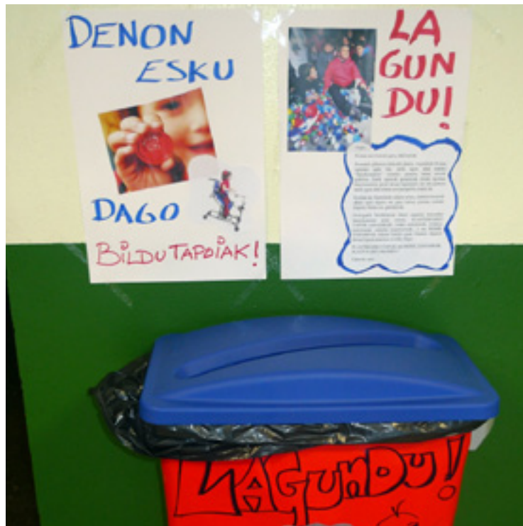
Kartelak ipini ditue ikastetxean ikasleak.