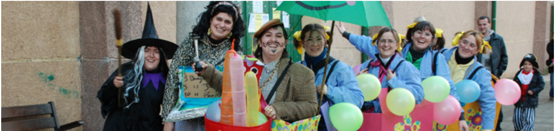
Aratusteak indarra hartzean dabiz geurean.

rreekaz kalte guztiak uxatu gura izan dira, herria eurengandik babestuteko; eta beste batzuek dinoenez, erromatarren agintaldiko jaietan daukie jatorria, Janoren Kalendatan, Saturnalia , Lupercalia , Matonalia izeneko jaietan.