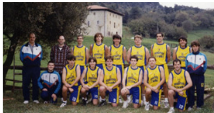
"Ez hain antxinakoak" dira argazkian agertzen diran jokalariek.