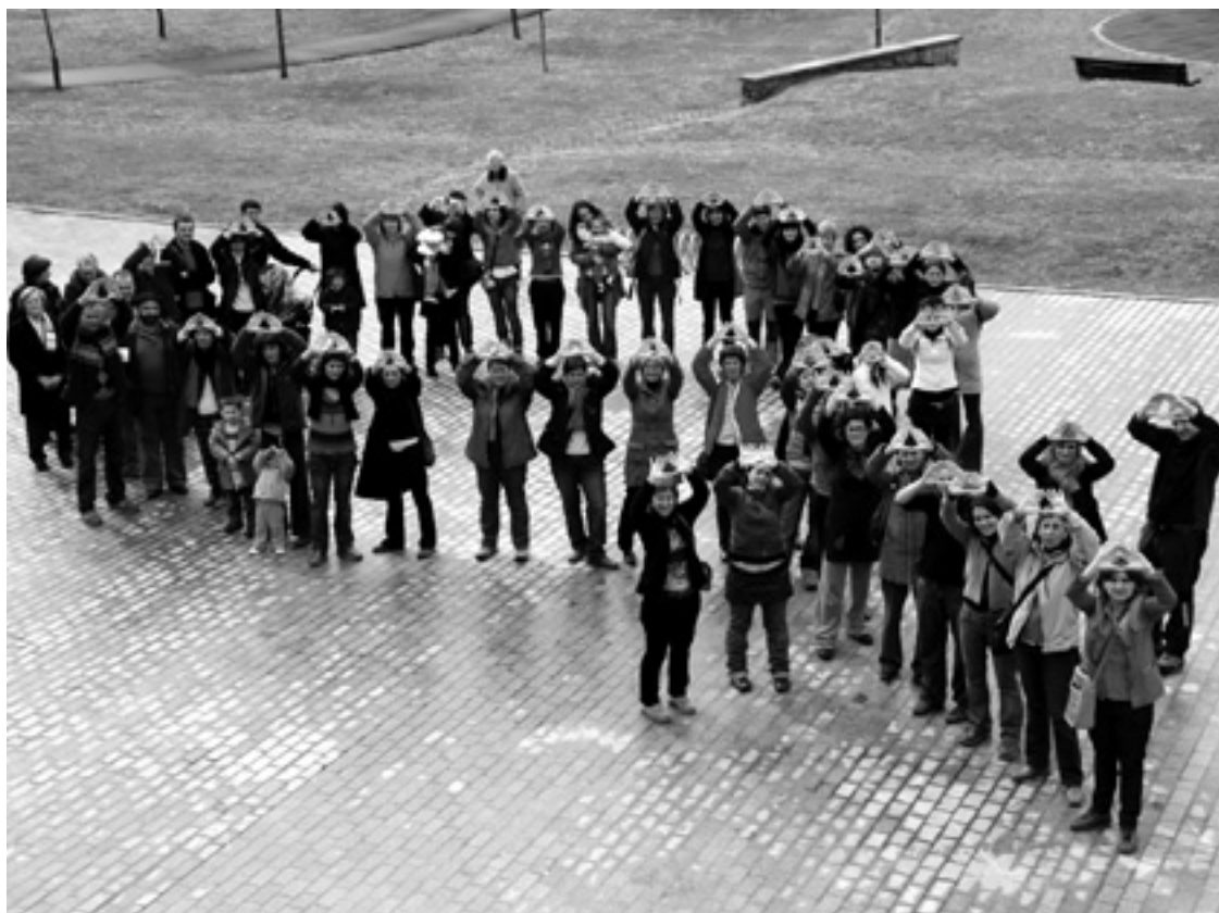
Martiaren 8an konzentrazioa egongo da Igorren.

Martiaren 8a, Emakumeen Nazinoarteko Eguna ospatzeko dozena bat baino ekitaldi gehiago antolatu dabez Arratiako andra talde eta Udaletako sailak: Areatzako Emakume Foroak, Dimako Andraize andra taldeak, Zeanuriko Mazala andra taldeak, Arteako Udal Emakume Arloak, Igorreko Udaleko Bardintasun Sailak, Lemoako Udal Emakume Arloak eta Bediako Udal Bardintasun Sailak, hain zuzen be.