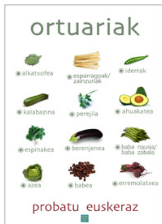
Komertzioetan ipini diran kartelak.

"Hiru aste iraun dauan kanpaina honen bidez, hizkuntza ohiturak aldatzeko baldintza egokiak ipini gura izan doguz, errezagoa eta erosoagoa izan daiten ohitura aldatzea" dino teknikariak.