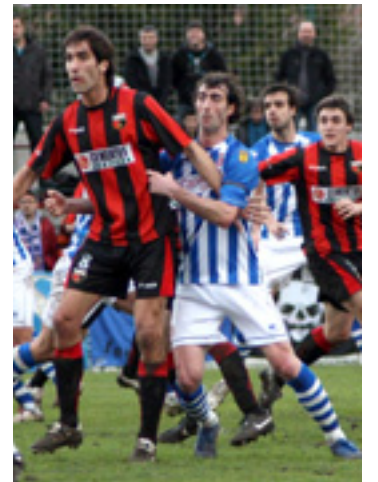
Lemoako taldea Torrelavegaren kontrako partiduan.

bardindu eben Erandiogaz eta gero galdu egin eben 3-0 Loiuagaz. Hamairugarren dira orain 26 puntugaz. Neskek be puntu bakarra lortu dabe azken bi jardunaldietan. 1-0 galdu eben Erandioko nesken kontra eta bana bardindu eben Santurtziko Peña Athleticen aurka. Halanda be, zazpigarren postuan jarraituten dabe 29 puntugaz.