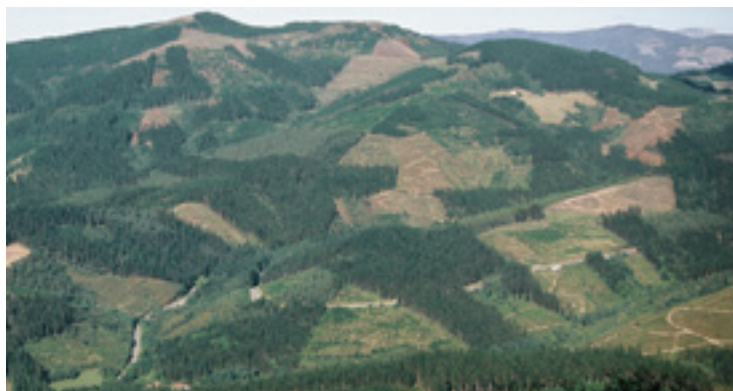
Pinuaren izurritearen kontrako tratamendua egingo dau Aldundiak.

Horrez ganera, Aldundiak izurriteari aurre egiteko beste metodo batzuk be erabilten ditu: beldarra jaten daben hegaztientzako habia-kaxak ipintea, lainoztagailuz egindako zuzeneko tratamendu puntualak eta poltsai produktu fitosanitarioa jauritzea, beste batzuen artean.