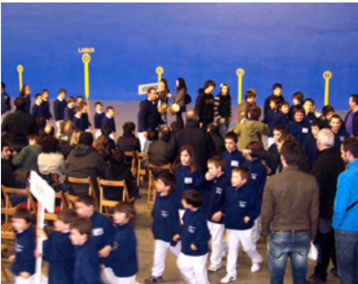
Pelotari gazteak finalean.