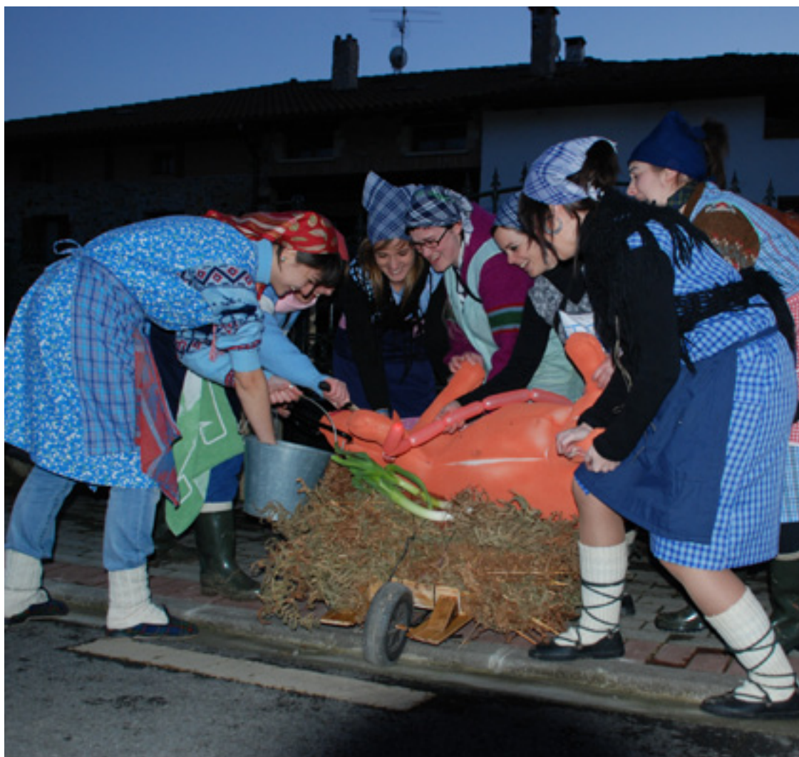
Koadrila bat txarria hiltzen dabizanaren itxurak egiten.

Kanporamartxo Hautsegun aurreko bigarren domekan ospatzen da