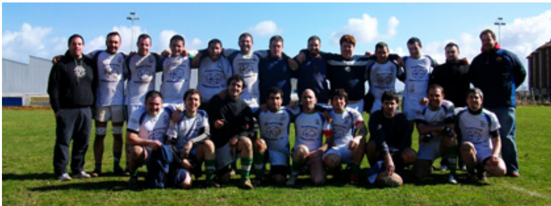
Arratiko Zekorrak Rugby Taldekoak Santanderren jokatutako azken partiduan.

postua nork lortu jokatzen dabiz Arratiko Zekorrak, eta holan jarraitu ezker lortu egingo dabe. Zekortxuak oster, zapatuan, zezeilak 26an jokatu eben San Txismen. Partidu polita gazteena eta giro itzela Gezalako zelaian. Bera-Bera taldearen aurka jokatu eben eta 19-12 nagusitu ziran etxeok.