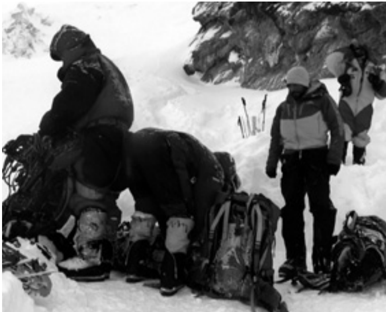
Txikonon espedizinoko lagunakaz.