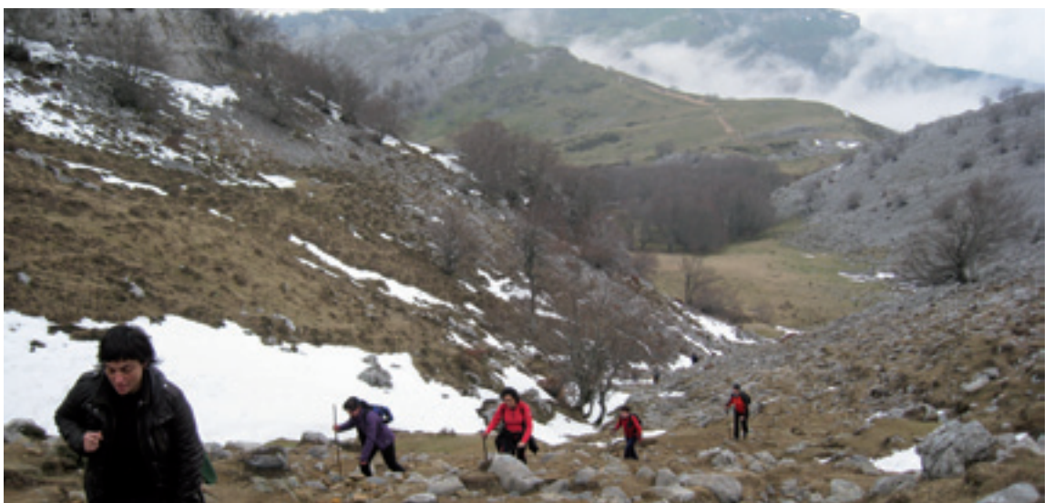
Arratiako Andren I. Mendi Martxea.

Arratia mailako alkarlanean egindako kartel horretatik kanpo ekitaldi gehiago dagoz herrietan. 5. orrialdea