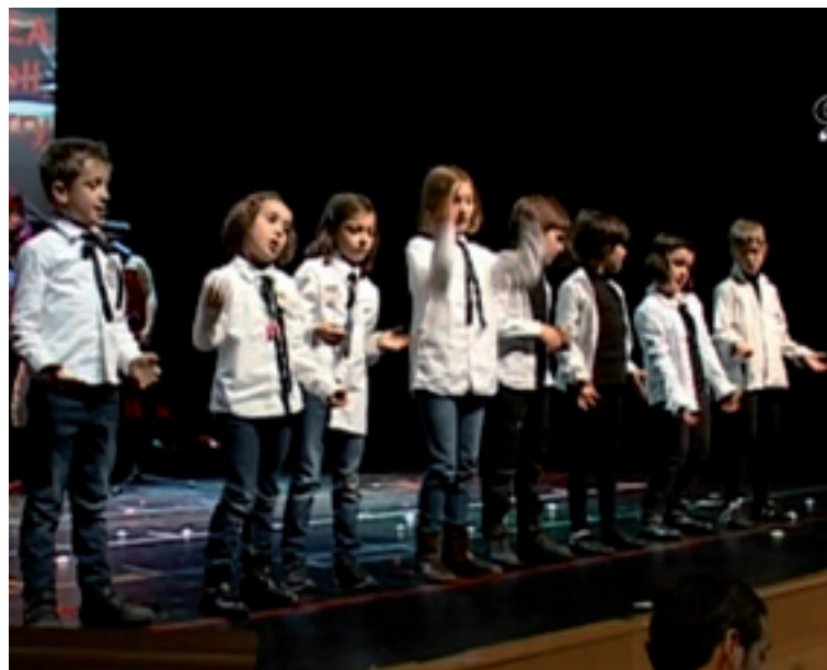
2014ko ipuin musikatua.

gether , Amelie pelikulearen soinu bandea eta beste pelikula batzuetako piezak lagunduko dabe ipuina