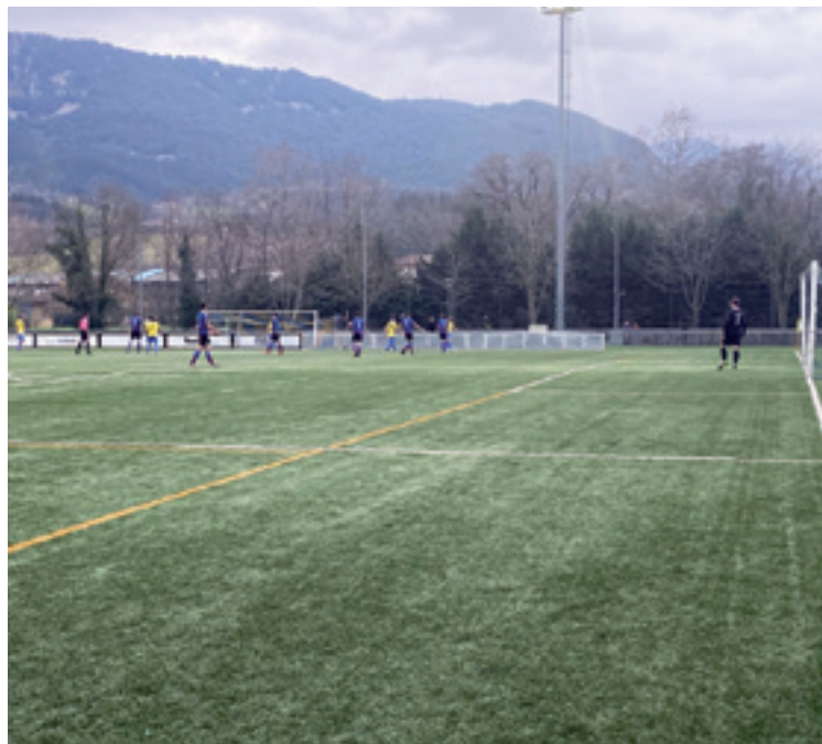
Gizonezkoen Arratia A eta Etxebarri Aren arteko partiduko irudia.

Arratiak Aste Santu aurrerako, apirilak 3, 4 eta 5, futbol kanpusa antolatu dau 2011 eta 2018 artean jaiotako -biak barne- ume eta gazteentzat. Kanpusa goizeko 09:30etik 14:00etara izango da, eta jolasak, urtekerak eta abar egongo dira; izena emoten dabenek 60 euro ordaindu beharko dabez. Izena cdarratia@cdarratia.com eta 688 777 117 eta 94 631 57 04 telefonoetan emon daiteke eta horretarako atzen eguna martiaren 24a izango da.