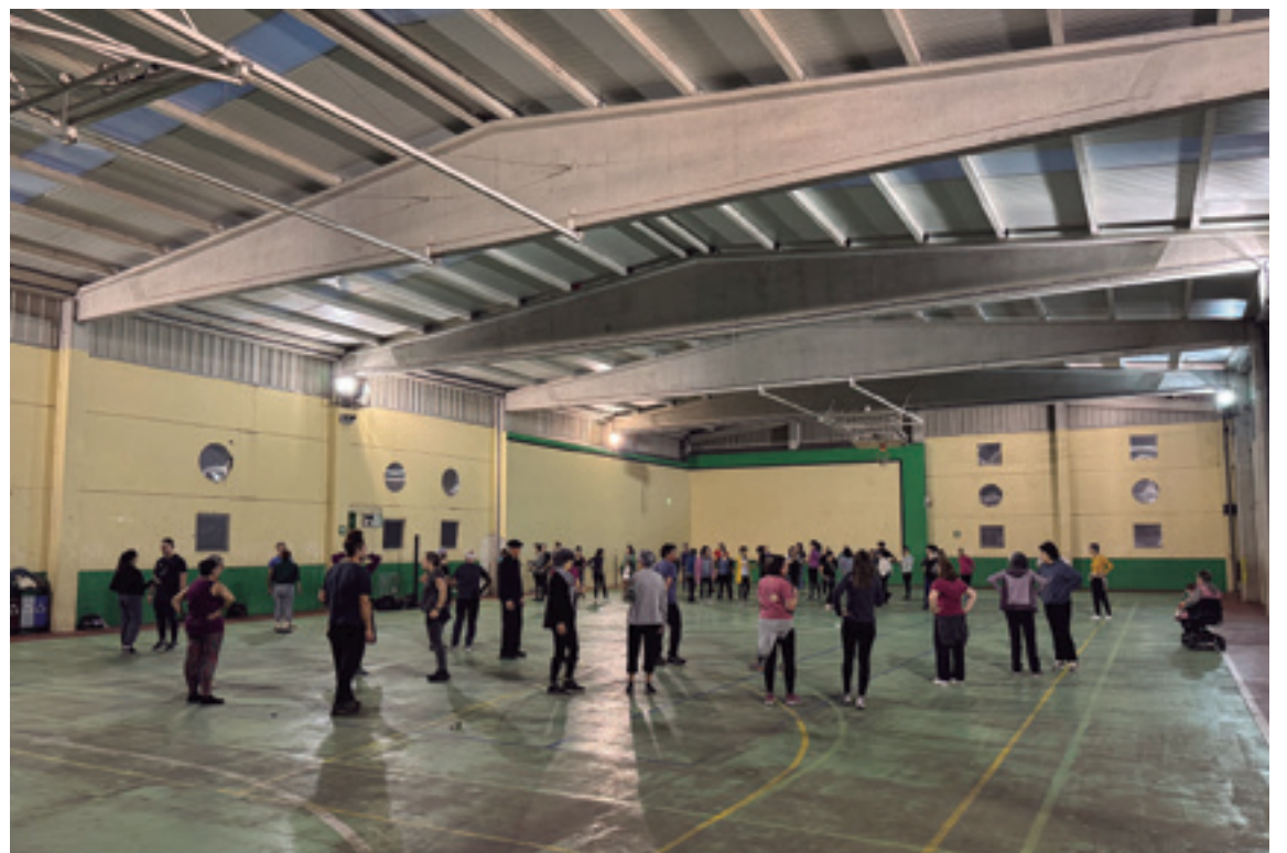
Arratiako jotea danontzat ikastaroko lehen saioa Igorren.