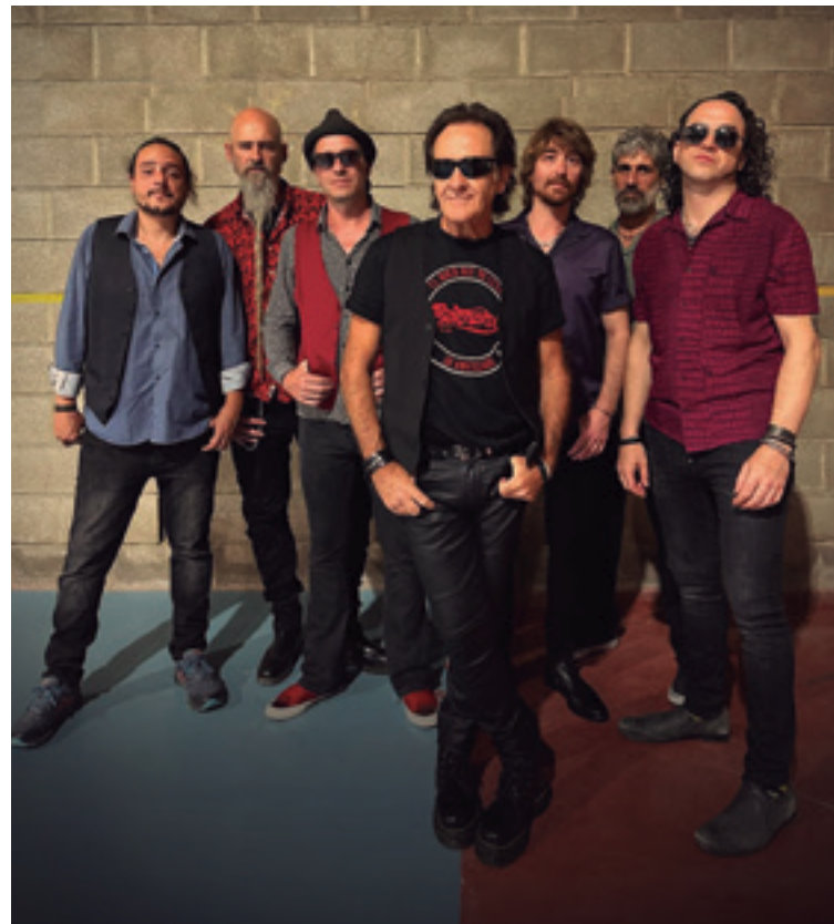
Igaz 50 urte bete ebazan Madrileko Burning taldea.

Burning (Madrid) Espainiako musika talde ezagunak be joko dau Areatzan. 1974an sortuta, bere jatorrizko estiloa mantenduten dau: rock and roll klasikoa, rhythm and blues eta blues nahasten dituan.