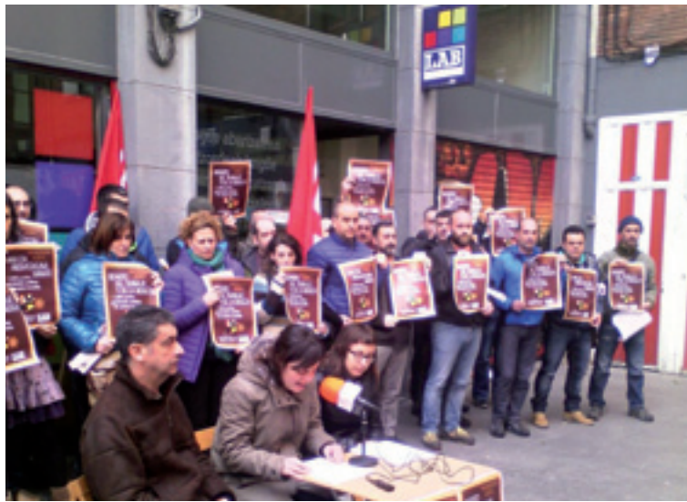
Basaurin emondako prensaurrekoa.

LAB sindikatuak emondako datuen arabera, kontratu barrien % 94 aldi baterakoak dira, gehienetan epe laburrerako, gero eta gehiagotan egun baterako edo aste baterako, eta asko, lanaldi partzialekoak. Honek etenbako pobretzea eta langileen eskubideen urraketea dakar.