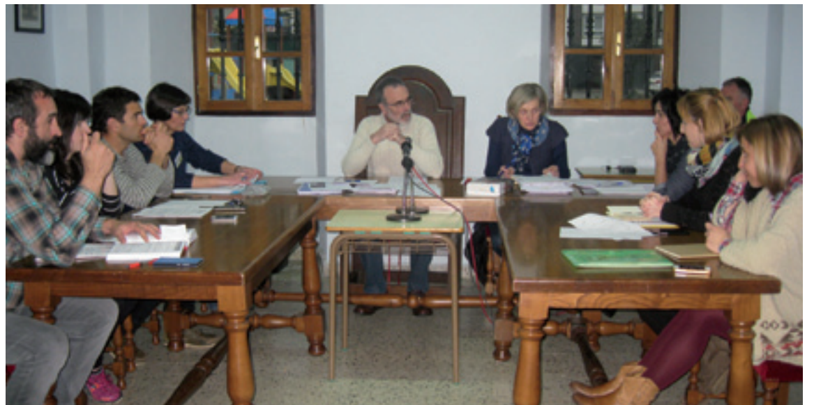
Zeanuriko martiaren 4ko plenoa.

Behin-behineko aurrekontu honetan, diru partidarik handienak,