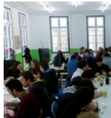
Aurkezpen egunean Zeberioko gazteen bazkaria.

Aurreikusita daukaguzan ekintzen edo ekimenen artean ondorengoak aitatu geinkez: auzo lana, auto-hornikuntza, bulderra, pelikulak, berbalak eta abar.