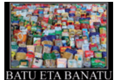
BATU ETA BANATU

Harribide Fundazioa Etxebarriko parrokia eta erakundeak osotuten dabe. Harribidek sei harrera-etxebizitza ditu etorkinentzat Bilbon eta Etxebarrin, hezitzaile eta boluntarioak tutorizata. Proiektu honetan gazte etorkinakaz egiten dau lan fundazioak.