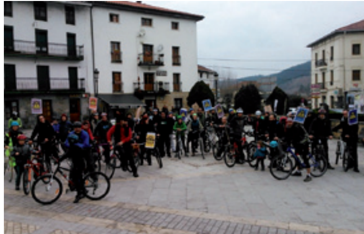
Bizikleta martxakoak Artean.