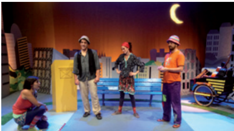
Kaleko musikariak ikuskizuna.

lasak eta jolas barriak ikasteko aukerea eskeiniko dabe. Izan be, euren ustez, jolasa biziten ikasteko modubat da. Jolasen bidez geure buruari helburuak ipinten ikasten dogu eta personen arteko hartu-emonak errezteko modua da, taldeak osotu eta trinkotzeko. Jolasa, ume eta gurasoen arteko loturak estutzeko bidea be bada; umeak eta gurasoak bizitzaren alderdirik atseginenez alkarregaz gozatuteko bitartekoa.