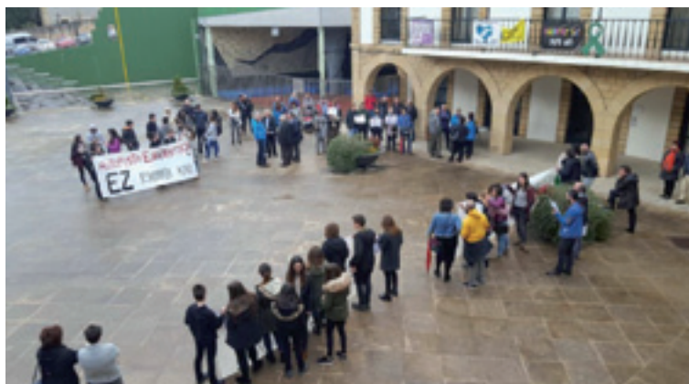
Igorren udaletxe aurrean martian egin zan konzentrazioa.

Beinat Anzola Igorreko alkatearen ustetan, Gueñes-Ixaso goi-tensinoko linearen lanak atzeratzeko eta Igorretik daukan trazadua aldatu eta aldentzeko aukera asko dagoz.