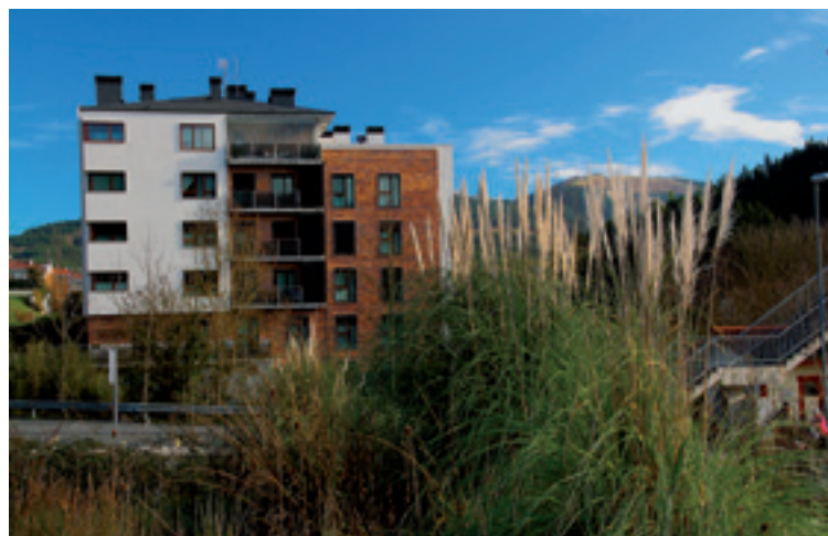
Panpa lorea Lemoan.

Jaiak 2017" esaldia agertu behar da kartelean. Sari bi egongo dira 175 eurokoak. Eskuz zein orde-nagailuz egindako kartelak onartuko dira, A4 neurrian. Kartelak egilearen sinadura barik aurkeztu behar dira.