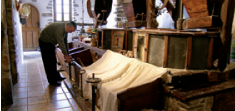
Olabarriko errotearen antepara.

Maiatzaren 7an izango da Zeanuriko Erroten XII. Ibilaldia.