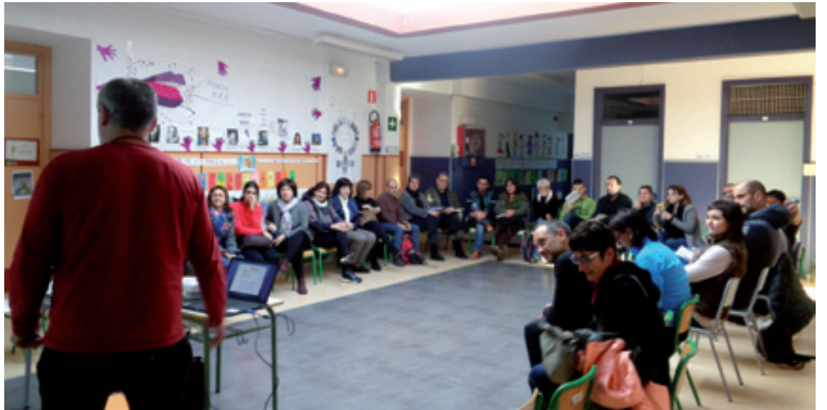
Ugarana eskolan egindako saio bat.

Umeen inplikazio eta ahalgintza sustatzeko, eskolan praktika egokiak bideratzen hasi ziran, umeak eurak hainbat jardura eta ekimenen kudeaketa eta planifikazioa eginaz. Herri mailan, Herri Hezitzailearen prozesuan murgiltzea ebatzi zan.