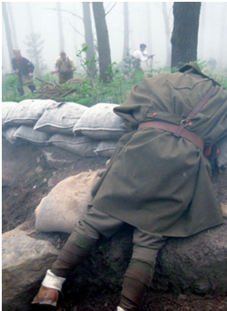
Igazko Lemoatxeko batailearen antzezpeneren irudia.

Memoria eta Kultura astean, Memoria Historikoaren gaineko berbaldi bi, ekitaldi bat eta mendi ibilaldia egongo dira.