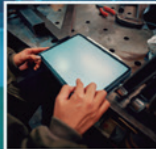
FABRIKAZIO MEKANIKOKO DISEINUKO GOI MAILAKO GRADUA