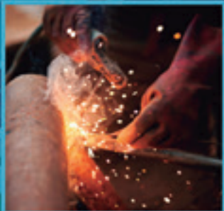
ELEMENTU METALIKOEN FABRIKAZIOA