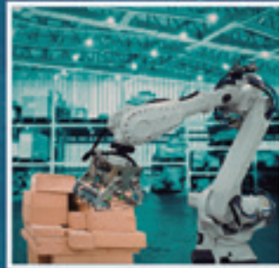
AUTOMATIZAZIOKO ETA ROBOTIKA INDUSTRIALEKO GOI MAILAKO GRADUA