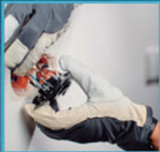
INSTALAZIO ELEKTROTEKNIKOAK ETA MEKANIKOAK