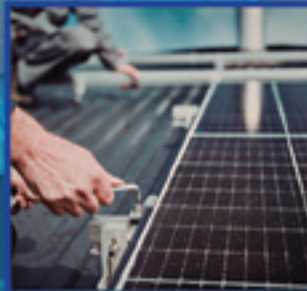
INSTALAZIO ELEKTRIKO ETA AUTOMATIKOKO ERDI MAILAKO GRADUA