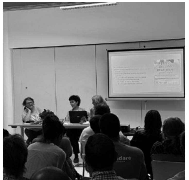
Igorreko Kultur Etxean izan zan berbaldia.