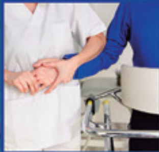
MEDEKOTASUN EGOERAN DAUDEN PERTSONEI ARRETA EMATEKO ERDI MAILAKO GRADUA