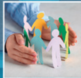
GIZARATERATZEKO GOI MAILAKO GRADUA