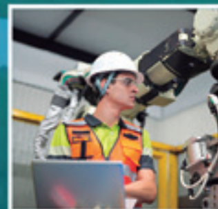
FABRIKAZIO MEKANIKOKO PRODUKZIOA PROGRAMATZEKO GOI MAILAKO GRADUA