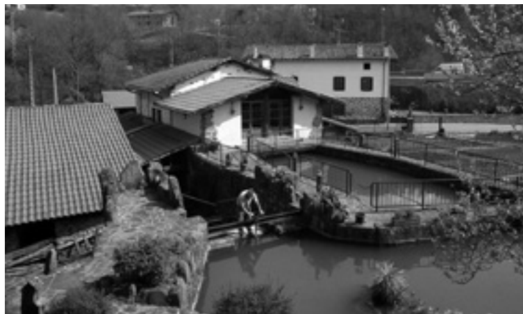
Olabarriko errota antepara beharrean.

Ibilbide bi prestatu dabez antolatzaileek, bata luzea, 14 kilometrokoa, eta bestea, laburragoa