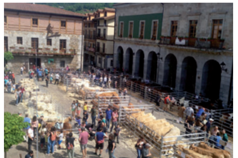
Areatzako plazea igazko Karpoko jaietan.