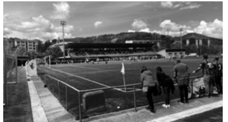
Arratia B eta Lemoako Harrobiren arteko partidua.

Lemoako Harrobik datorren partidua Arlonagusian jokatuko dau Amorebieta B taldearen kontra maiatzaren 6an, arrastiko 18:00etan eta Arratia Bk etxetik kanpo jokatuko dau Etxebarri B taldearen kontra hilaren 6an, 18:15ean.