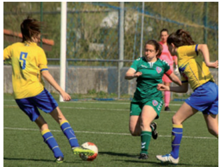
Arratiak Urbietan jokatu partidu bat.

Arratia B taldeak osterana bana bardindu eban Basurtoren kontra jokatu atzen partiduan.