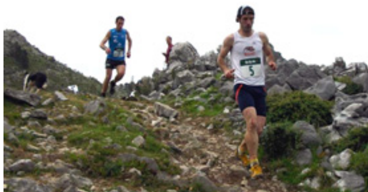
Igazko irudi bat.

Lasterketea urri bigarrenaren 1ean izango dan arren, zabalik da IV. Anboto Kilometro Bertikalean parte hartu ahal izateko izena emoteko epea, bagilaren 30era arte. Izena emotean 20 euro pagau beharko dabe federauak eta 25 federauta ez dagozanak. Gehieneko partaidetzea 350 lagunekoa izango da. Lasterketa hau Espainako Koparen zirkuituan sartuta dago, eta aurten,