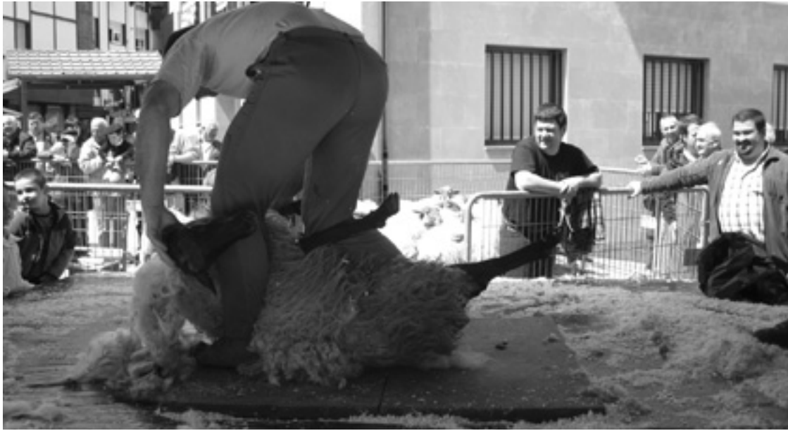
Igaz San Isidro egunean artzaina ardiari ulea moztuten.

Arratiako baserri giroko jairik handiena ospatuko da Zeanurin maiatzaren 15ean, San Isidro egunean.