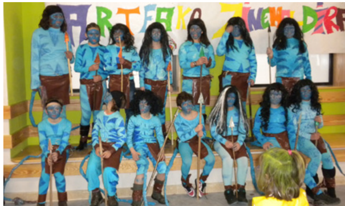
Arteako 5. eta 6. mailako ikasleak mozorrotuta.

Bukatzeke eskerrak emon gura deutseguz, Arteko Zinemaldia aurrera eroaten lagundu euskuen guztiai, eta hemendik hurrengo urteko zinemaldiaren konbidapena zabaltzen deusuegu.