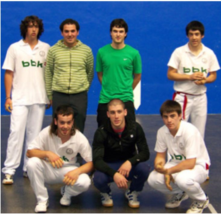
Herriartekoa olgetan dabiz Dimako pelotariak.