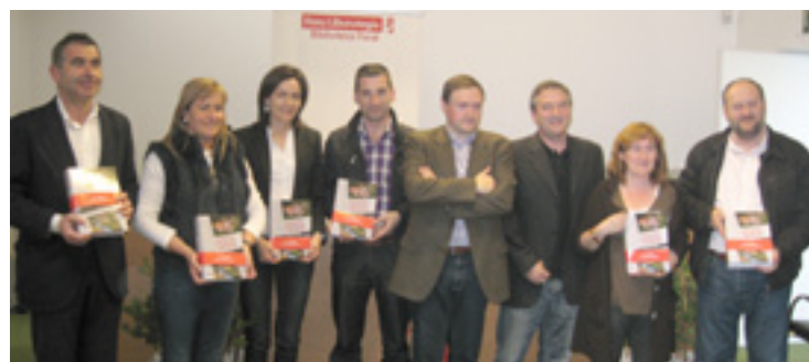
Arratia Inguruko Hiztegiaren egileak ordezkari politikoakaz.

Zuzendu bakarrik ez, osotu be egin dabe hiztegia. Holan 100 eta 150 arteko berba barri sartu dabez, gehienbat etnobotanikakoak, baina baita gazteen argota eta kaleko berba zakarrak, hau da, "sexuagaz lotutako berba 'berdeak'".