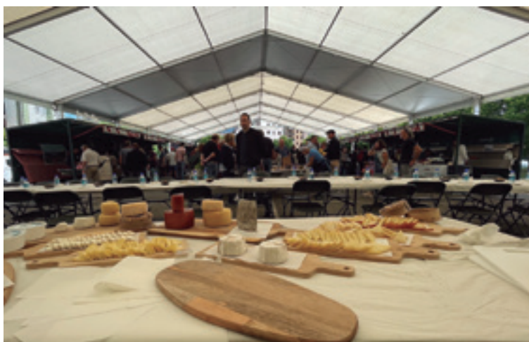
Lehen urteko gaztai eta esnekien azokako irudia.

Oin hiru urte hasi zan Gorbeialde Landa Garapenerako Elkartea inguruko gaztai eta esnekiak ardatz hartuta Igorren azokea antolatuten eta atzen urte bietako arrakastearen ostean, geldituteko etorri dan merkadua dogu.