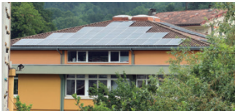
Plaka fotovoltaikoak Dimako eskolako teilatuan.

Urte biren ostean, frutuak emon dauz Dimener Energia Barriztagarrien Komunitatearen lanak.