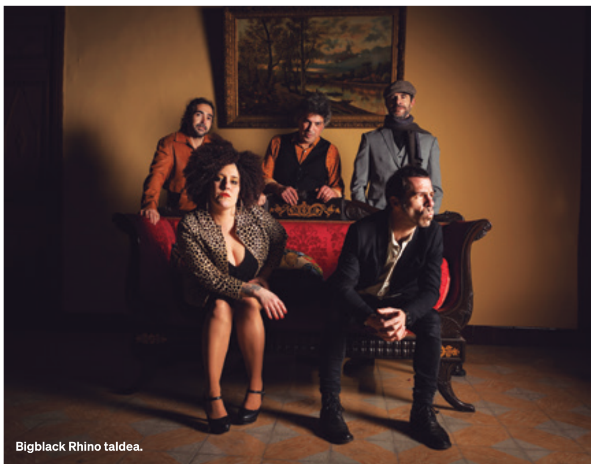
Bigblack Rhino taldea.

Blues sakona, swamp-rock giro ilunak eta psikodelia ukituak buztartzen dituan proiektua da hau. Hegoaldeko Estatu Batuetako soinu baltz eta hipnotikoak ekarriko dabez, erritmo geldo baina intensidatez betetako pasarteakaz eta eszenatokian nortasun handia erakutsiaz.