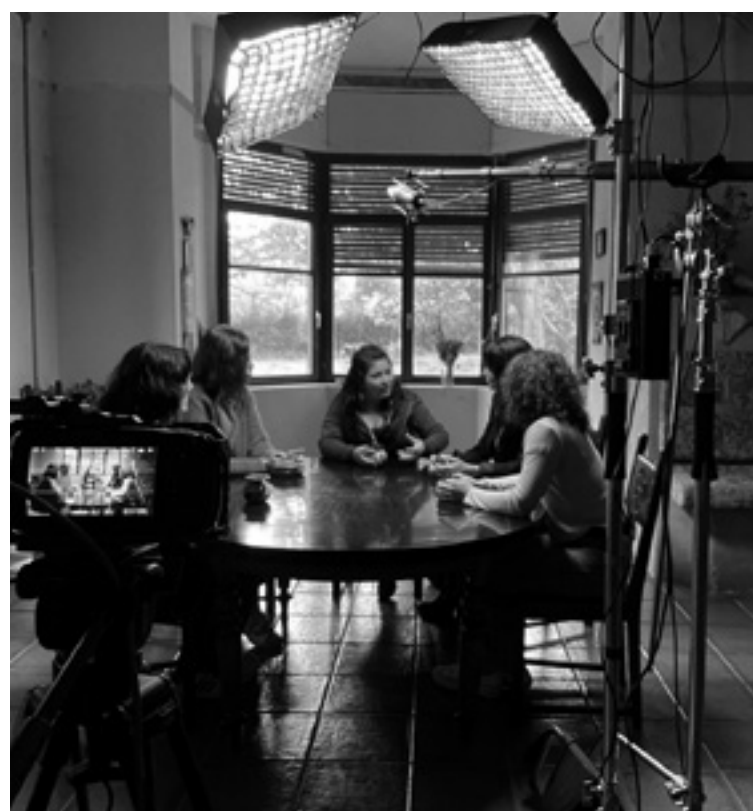
Acuerpadas, hasta que se haga justicia filmaren grabazioa Artean.

Hilaren 27an Acuerpadas, hasta que se haga justicia eta 29an El caso Freytter egongo dira ikusgai, protagonisten solasaldiakaz.