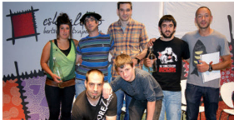
Arratiako Bertsolari Txapelketako protagonistak.