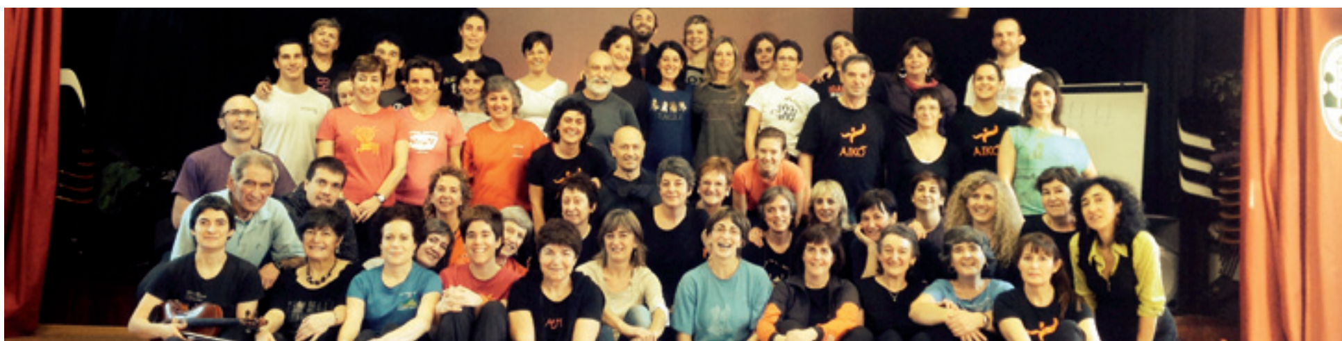
Areatzan egin zan atzenengo jantza astegoienero familia argazkia.

2014ko maiatzaren 15a hamabostekaria www.begitu.org