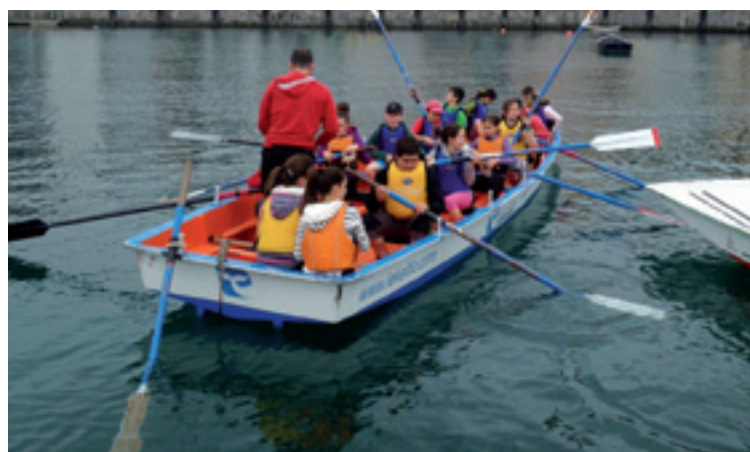
6. mailako ikasleak.