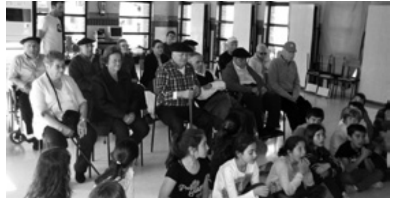
Umeak edadekoakaz batera.