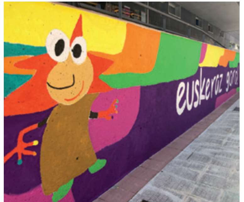
Zuztertxuren irudia Kultur Etxeko horman.

Aurreko urteetan baino modu apalagoan eta "babes, segurtasun eta higiene neurri guztiak jarraituta", euskereak bizirauteko, euskerea erabili behar dala eta kulturea dala horretarako bide egokia gogoratuko dabe igorretarrak Inbiu egunean. Goizeko 11:00etan hasiko dira ekitaldiak Kultur Etxeko plazan, umeentzako irakurketa saio bategaz eta, gero, 12:30ean, helduentzako