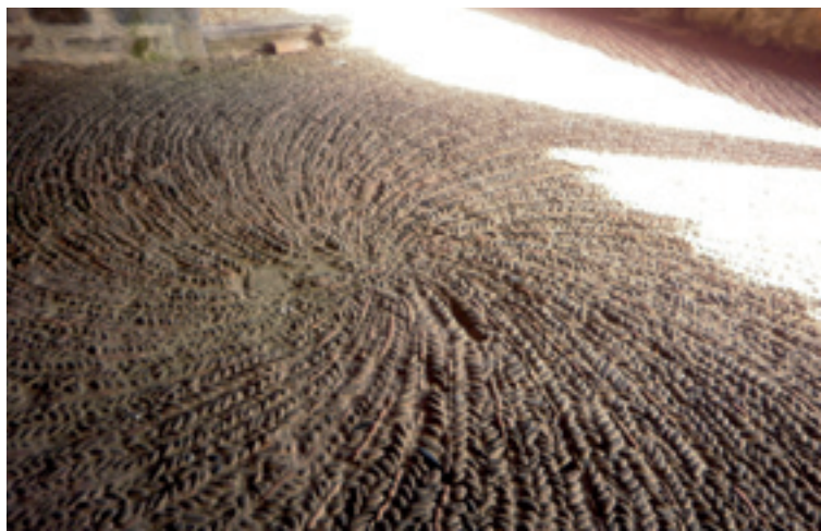
Olabarrietako Santo Tomas eleizako eleizpeko lurra.