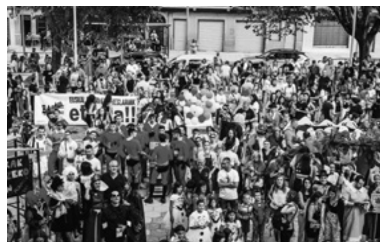
Igazko Lemoako jaietako irudi bi.