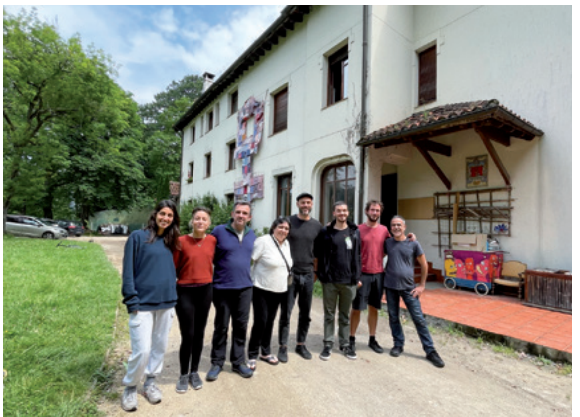
Aita Marikoak Arteako eskolako umeakaz goiko argazkian eta Basoan behekoan.

Argeliatik be hasi dira gero eta gehiago urteten... Uda gogorra izango da Mediterraneoan