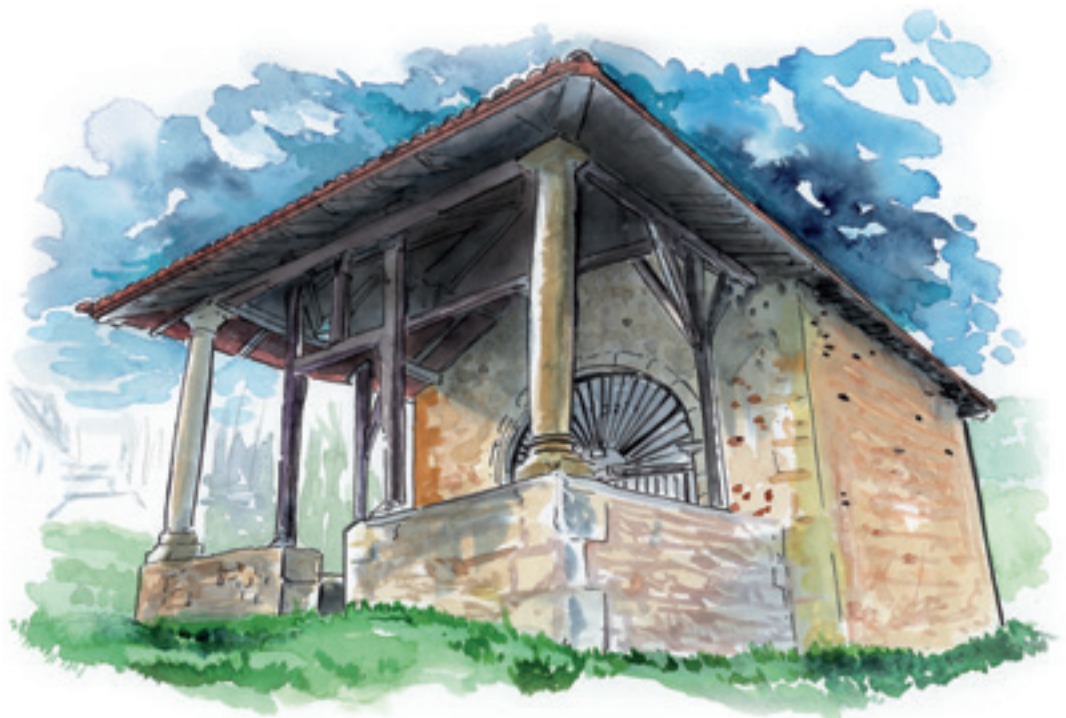
2023an Igorreko Udalak ateratako egutegiko bagileko irudia.