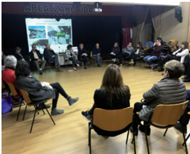
Gure Esku Dagoko batzarra.

Areatzako batzarrera, 30 persona hurreratu ziran.