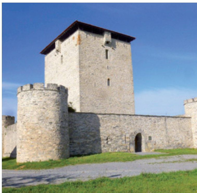
Zeanuriko Axpe jauregia goian eta Mendozako torrea behean.