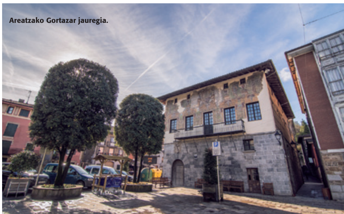
Areartzako Gortazar jauregia.

Testua non jaso zan ez dakigu, baina bai bertan igarri geinkez XV. mendean bigarren zatian, 1468 aldean, Arratiako eta Arabako Zuiako leinu nagusien arteko ezinikusiak eta eten bako burrukak. Gaur egungo Zuia udalerrian dagoan Markia herria norbereganatuko eta lur horreetan nor gailenduko, etenbakoak gertatu bide ziran erasoak, hilketak eta