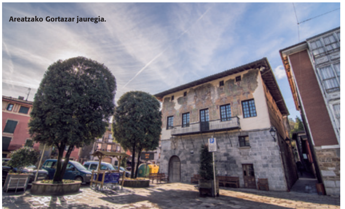
Areartzako Gortazar jauregia.

Testua non jaso zan ez dakigu, baina bai bertan igarri geinkez XV. mendean bigarren zatian, 1468 aldean, Arratiako eta Arabako Zuiako leinu nagusien arteko ezinikusiak eta eten bako burrukak. Gaur egungo Zuia udalerrian dagoan Markia herria norbereganatuko eta lur horreetan nor gailenduko, etenbakoak gertatu bide ziran erasoak, hilketak eta