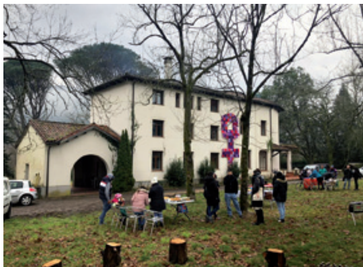
Basoa etxea Artean.

Hasikerako oztopoak gaindituta, helburua da familia eta persona horreek independente izatea, ez eukitea ezelango dependentsiarik ez OEEgaz, ez estaduagaz, ez beste edozein erakundegaz.