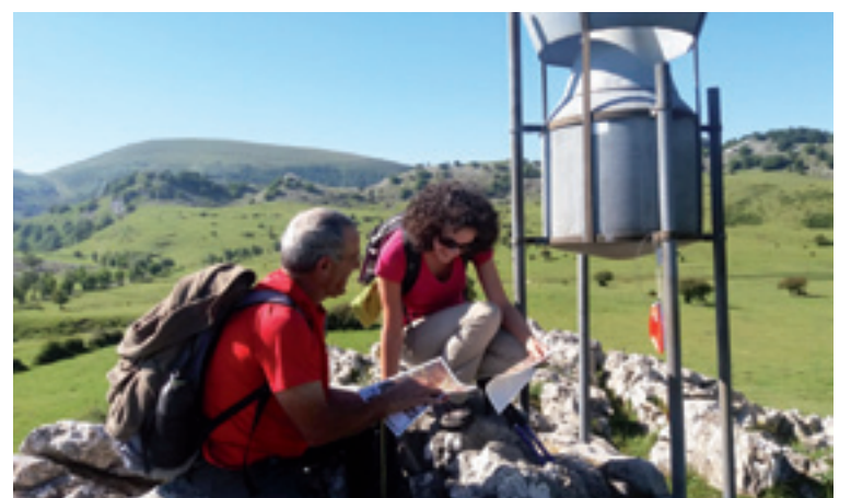
Orientazio probako partaideak.