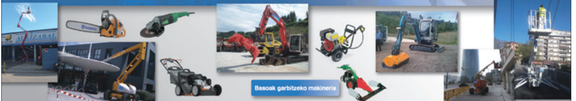
Basoak garbitzeko makineria