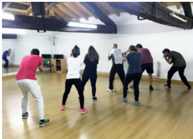
Areatzako ikastaroko ikasleak.