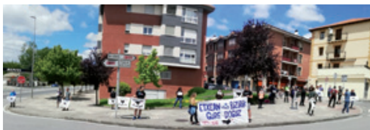
Maiatzaren 24an Lemoan egindako konzentrazioa.