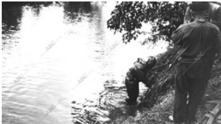
Bilboko portuko buzo batek Ibaizabal erreka arakatu eban Lemoan, hildakoen bila.