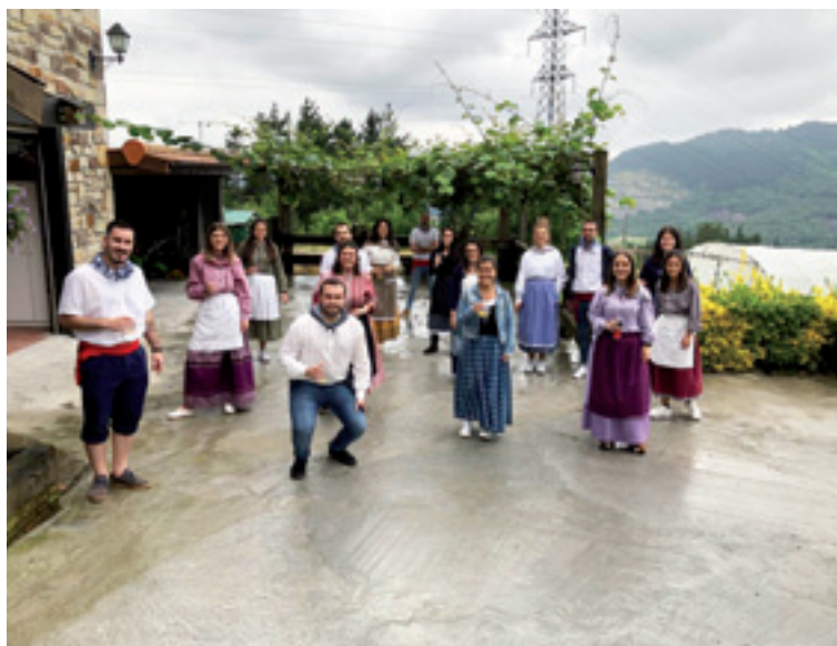
Lemoako Euskal Jaia.