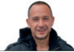
IBON IZA Irakaslea

Ahal zan moduan koordinata, mendi tontorreko lausoa begietatik kendu ezinik, aurrera, aurrera