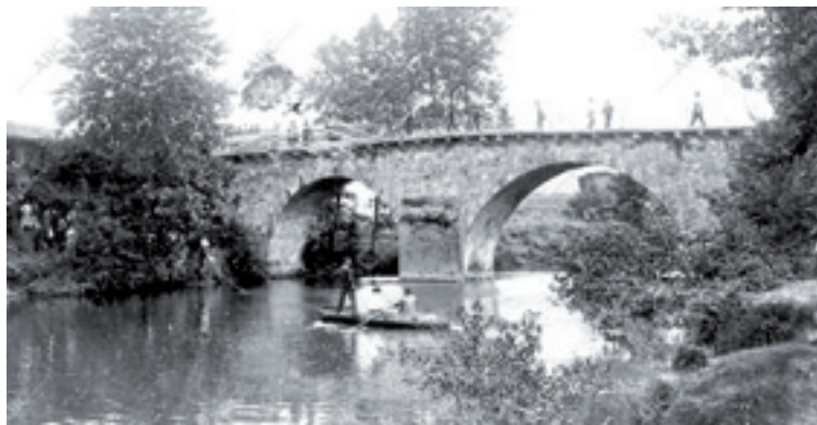
Zubiare zuba.

Biktimai emondako lehen laguntzea, zubiaren inguruko