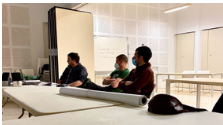
Batzarrera hurreratutako kide batzuk.

Kirol diziplina desbardineta Arratiako hainbat kirolari eta alkartetako kide "Gu ere bai" ekimenera batu dira, euren kiroletan Euskal Herriko Selekzinoan eta modu ofizialean lehiatu ahal izateko.