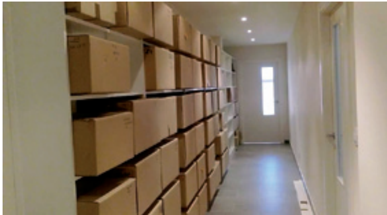
Giza gorpuzkinen biltegia Ubideko Adituren laborategian.

herritarrai eskerrak emon gura deutseguzala; oin dala hamar urte baino gehiago hemen jarri genduan gure enpreari sano harrera ona egin eutsielako. Uste dot ondo integratu garala eta komunitadeari zeozer emon gura geuntsan. Beste alde batetik, Ubide lango herri txiki baten, hemen bizi diran persona askoren arteko familia loturearen ziurtasuna dago, eta hori agerian itxi gura dogu, ubideztarrak lotzean dituan familia harreman historikoen barri emongo dauan azterlan baten bidez.