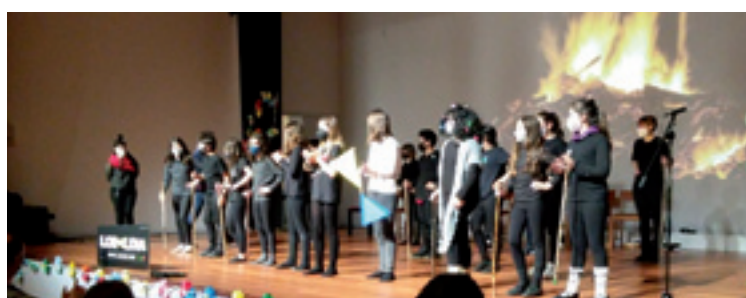
Dimako seigarren mailako ikasleak.

Emozino handia egoan estreinaldi egunean Bilboko Bizkaia Aretoan. Estreinaldia 2020ko martiaren 27rako egoan aurreikusita eta gero maiatzaren 22ra atzeratu zan. Ezin izan zan egin. Atzenean, 2021eko martiaren 19an izan zan eguna.