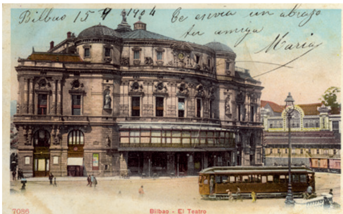
Arratiako tranbia Arriaga Antzokiaren plazan. 1904ko urri lehenengoan zigilatutako posta-txartela.