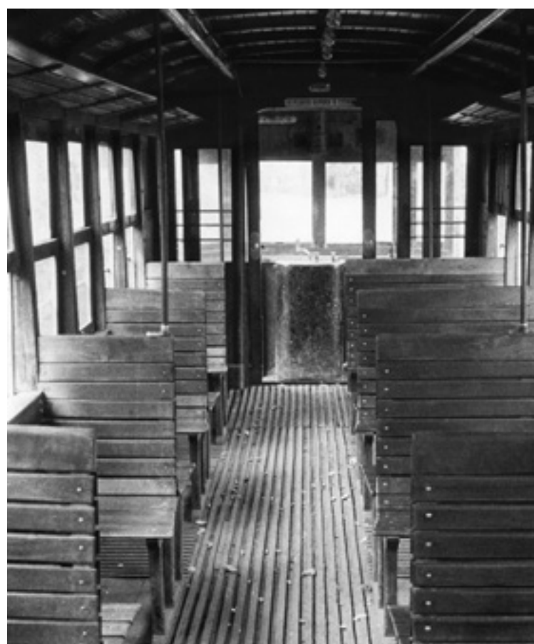
Bidaiarientzako tranbia baten barnekaldea.

egin eban Lemoatik Garberainoko bidea, txistulari, trikitilari eta albokariaren doinu eta jentearen txalo eta oihuen artean. Gertaera hori sasoi haretan hain ospetsua