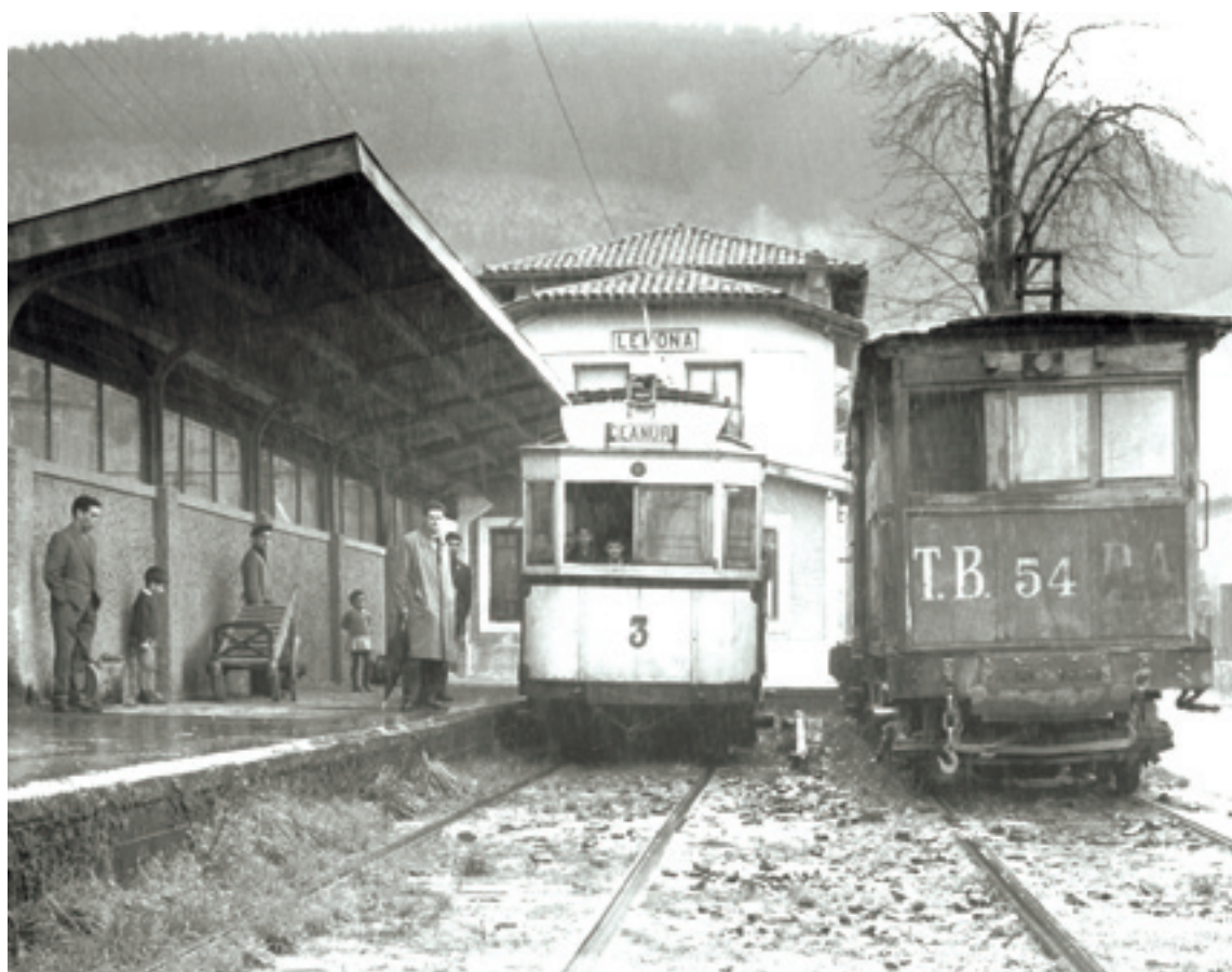
Lemoa zan Arratiako tranbiaren bihotza. Hemendik Durangorantza edo Zeanurirantza abiatzen ziran tranbiak.

Amorebieta-Etxano, Durango eta Arratiako herriak euren artean eta Bilbogaz hartu-emonetan ipinten ebazan tranbiak