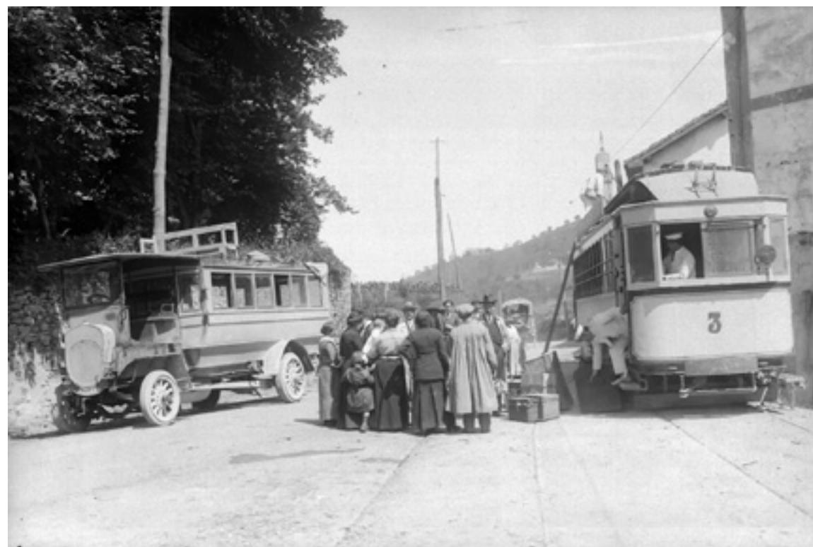
Hiru zenbakidun tranbia eta Gasteizerako autobusa Zeanuriko geltokian.